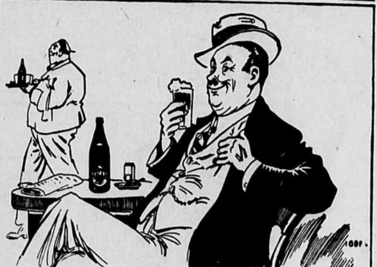
Tas-pas ensuite essayé une BLACK HORSE ? Ça fait revoir les choses sous un jour plus agréable!

Dites simplement — "Bière BLACK HORSE" Dawes, s.v.p."