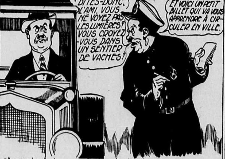
et pendant deux ou trois minutes, tu te fais servir un savon en règle.