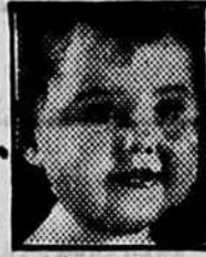
TABLETTES BABY'S OWN du Dr. Williams