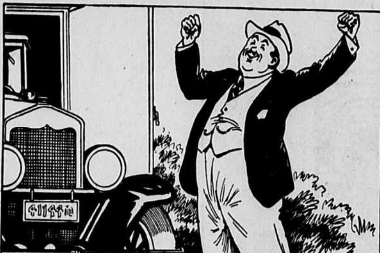
Tas-pas déjà commencé une belle journée d'été en excellent humeur, dans les meilleures dispositions à l'égard de tout le monde —