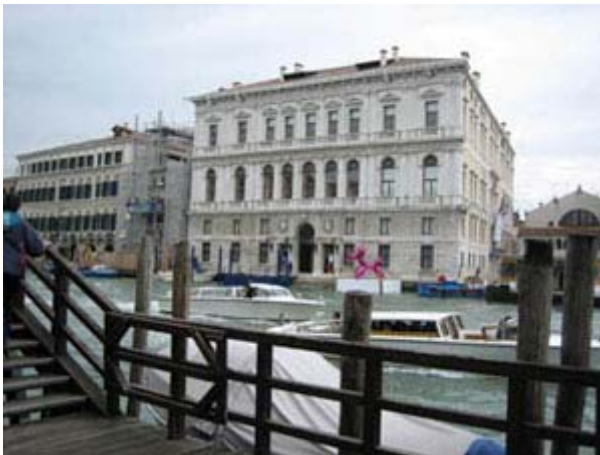
Le Palazzo Grassi à Venise