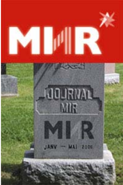
Magazine Internet MIR