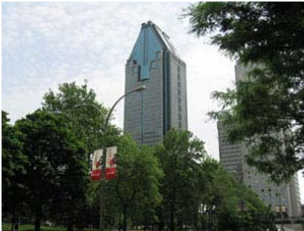
Centre ville de Montréal

La 12e édition de la Conférence de Montréal aura permis de faire le bilan sur la situation économique du monde et de proposer des avenues pour l'avenir. Plusieurs observateurs ont remarqué la grande qualité des débats et certains ont même comparé ce rassemblement à la Conférence de Davos. Les participants provenaient de secteurs aussi différents que l'Asian Development Bank ou que la Fédération des producteurs de lait du Québec. Cette présence de nombreux secteurs économiques à la Conférence 2006 est l'un des signes du succès entourant le projet démarré par Gil Rémillard. www.conferecedemontreal.com