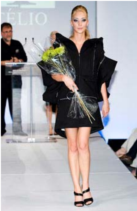
Modèle Téliio

L'industrie de la mode québécoise sera à l'avant scène durant les