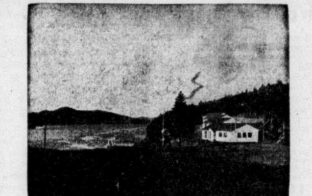
Un des aspects du Camp-école du lac Trois-Saumons pour jeunes garçons à partir de l'âge de neuf ans. Tous les jeux et les sports y sont enseignés et pratiqués de façon rationnelle et en toute sécurité.

ASPECTS GÉNÉRAUX Le Camp-Ecole est installé à quinze cents pieds d'altitude, en pleine forêt, sur les bords d'un lac magnifique de près de cinq milles de long. Le domaine du camp est des plus vastes et comprend des terrains plats et nivelés, d'autres montueux et ombragés qui se prêtent bien à toutes les fantaisies de la jeunesse. Les eaux du lac bordent le camp et assurent une plage sableuse et bien abritée. Le peu de moustiques est à signaler.