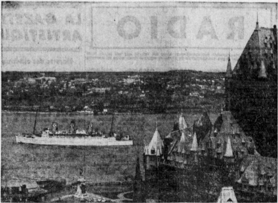
DE NOUVEAU DANS LE SAINT-LAURENT — L'Empress of Scotland, 26,300 tonneaux, le plus gros et le plus luxueux paquebot du Pacifique Canadien, effectuera 20 traversées de l'Atlantique, au cours de la présente saison de navigation dans le fleuve. L'Empress of Scotland, avec les deux autres paquebots des Canadian Pacific Steamships, l'Empress of Canada et l'Empress of France, qui remontent le Saint-Laurent jusqu'à Montréal, assurera ainsi un service hebdomadaire régulier entre le Canada et l'Angleterre, durant la saison. On voit ici le majestueux Empress of Scotland dans le port de Québec, comme il passe en face du Château Frontenac.