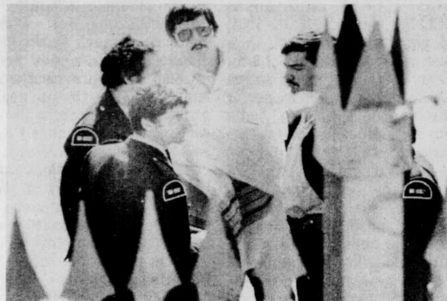
Un gardien de prison se réchauffe sous une couverture, tandis que le sit-in continue, après une nuit d'émeute à la prison de Bordeaux.