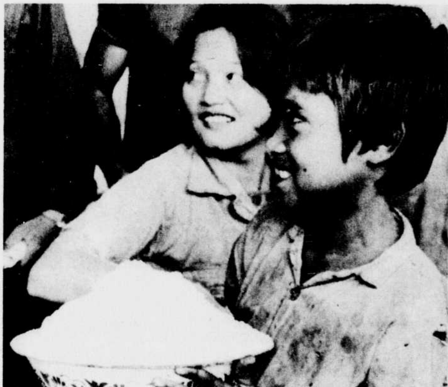
La Banque Mondiale rapporte une progression de 0,3% à 0,4% à la production agricole dans les pays du Tiers-Monde en 1981.

Cette stagnation et même ce déclin de la production agricole en