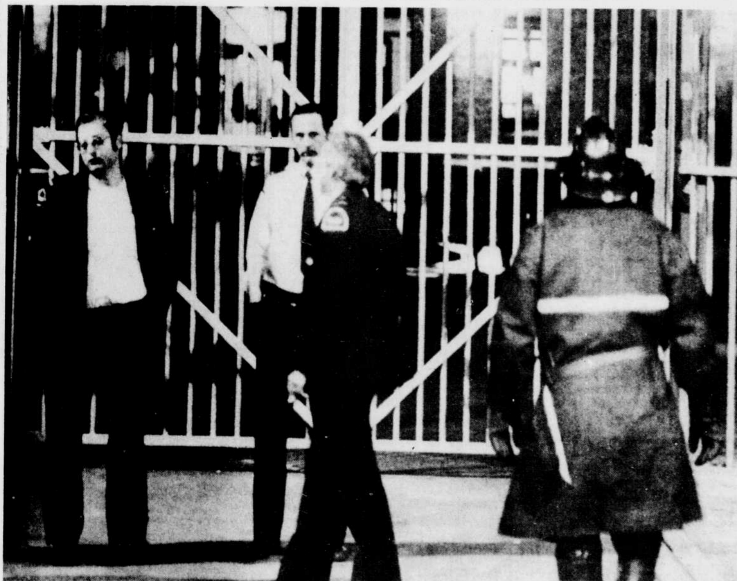
Les gardiens se tenaient à l'extérieur tandis que les pompiers et la police anti-émeute venaient à bout du soulèvement des détenus à l'intérieur de la prison de Bordeaux.