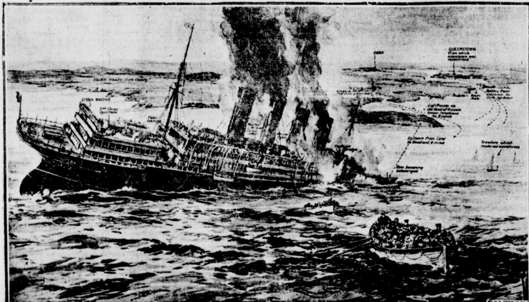
Restes du Lusitania, au cours du malheureux naufrage.