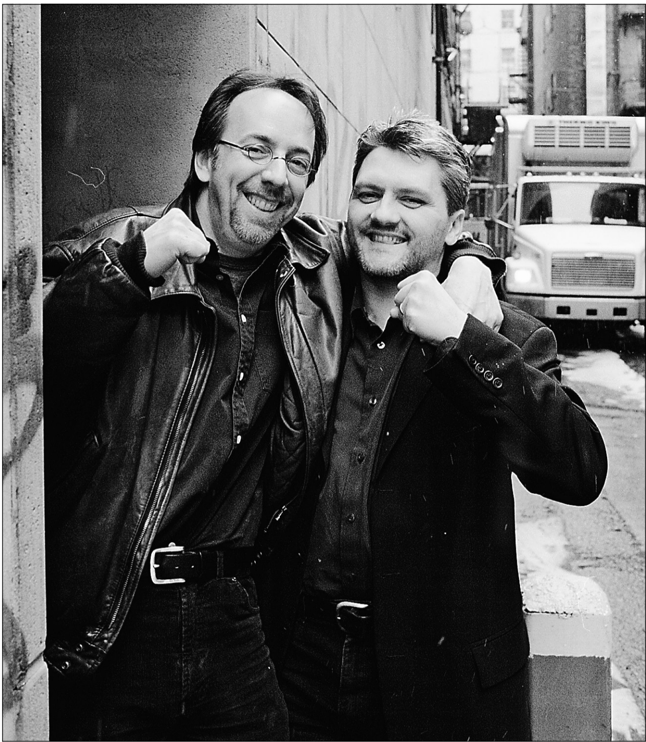
Benoît Dutrizac et Richard Martineau ont enterré la hache de guerre après leur chicane très publique qui avait débuté au printemps 2005.