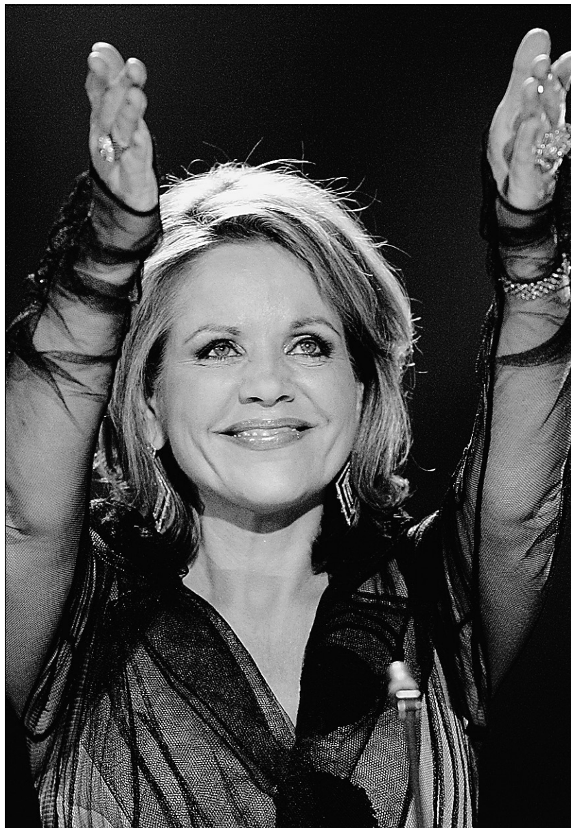
Renée Fleming chante ce soir avec l'OSM à la salle Wilfrid-Pelletier.

Confirmé: la Deutsche Kammerphilharmonie Bremen (Phil-