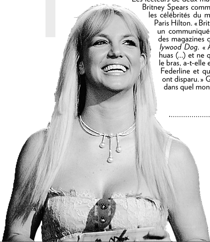
Britney Spears