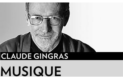
CLAUDE GINGRAS MUSIQUE

L'Orchestre Symphonique de Montréal présente deux concerts de Noël cette semaine: ce soir, 20h, salle Wilfrid-Pelletier de la PdA, avec la soprano américaine Renée Fleming, et demain soir, 19h30, basilique Notre-Dame, avec la soprano montréalaise Karina Gauvin.