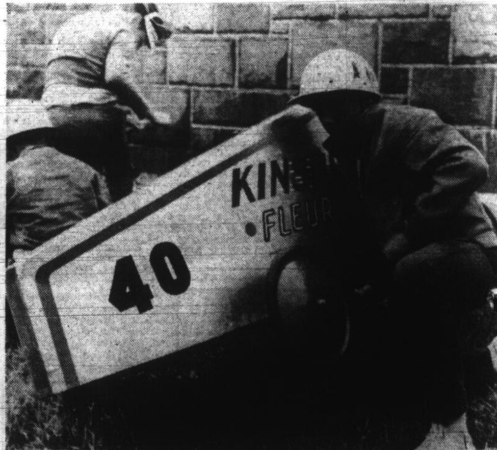
Le jeune Yves Gaudin, de Laval-des-Rapides, vérifie une dernière fois le bon fonctionnement de la "boîte à savon" qu'il a fabriquée lui-même en prévision de la course... de l'année!

Achetez tout de suite votre nouveau journal "PHOTO SPORT"!