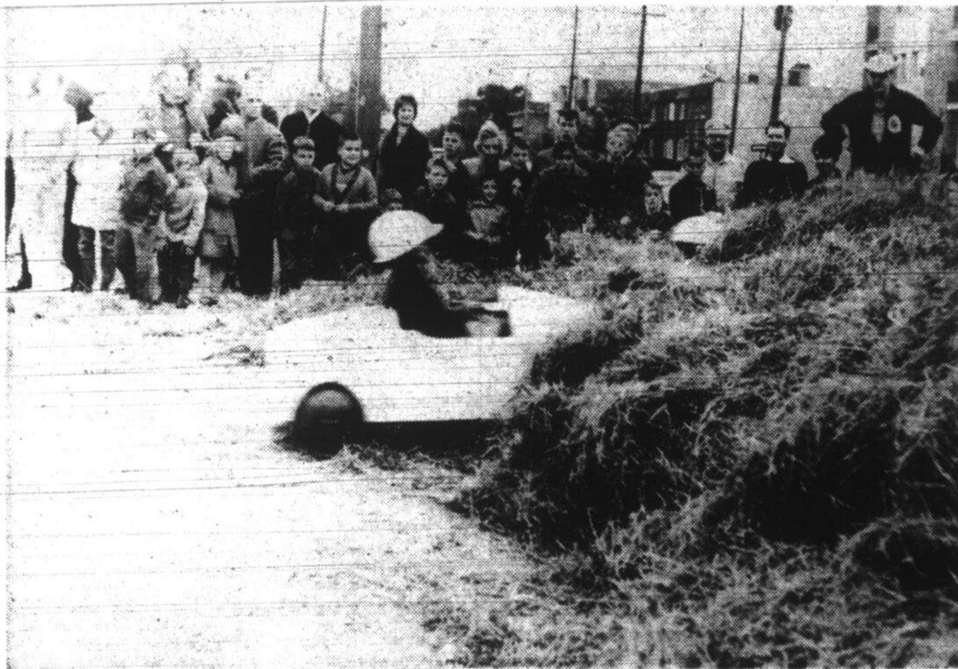
Une quarantaine de jeunes sportifs de l'île de Montréal ont participé, hier, à la 23ème course annuelle de "boîtes à savon", organisée par le club Kinsmen, au profit de la jeunesse. Une volumineuse bar ricade de paille avait été placée au bas de la "piste", pour arrêter les bolides qui, évidemment, n'ont pas plus de freins que de moteur.