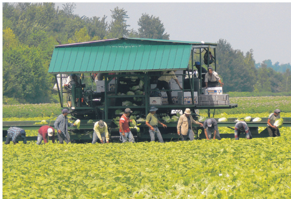
Plus de 125 travailleurs du Guatemala ne sont pas retournés chez eux après la période des récoltes, dont certains étaient à l'emploi de producteurs dans la MRC des Jardins-de-Napierville.

Un comité parlementaire fédéral qui s'est penché sur le sujet a récemment recommandé d'abolir cette limite de 48 mois. Le