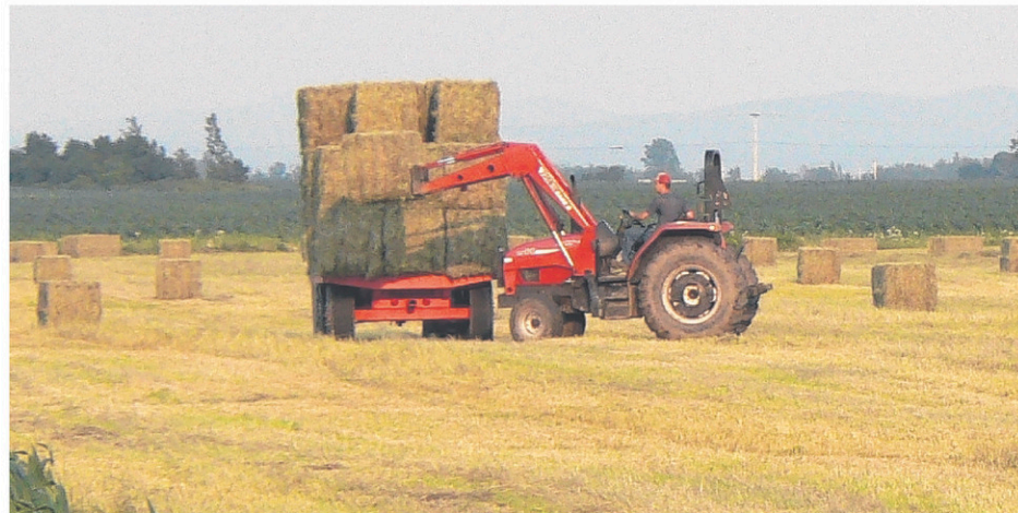
Les agriculteurs craignent les effets de la modification du Programme de crédit de taxes foncières d'ici quelques semaines.

Les producteurs demandent au gouvernement libéral de retarder d'un an l'entrée en vigueur de cette mesure pour leur donner le temps d'en étudier les impacts.