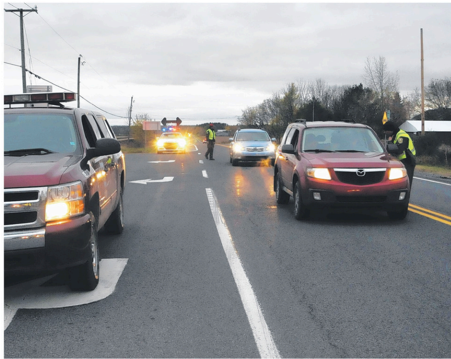
Les agents de la faune, assistés des policiers de la Sûreté du Québec, ont effectué un contrôle routier à Saint-Bernard-de-Lacolle, le 30 octobre.

Au total, une soixantaine de personnes ont été rencontrées. Les agents de la faune ont remis des amendes à neuf individus, âgés de 30 à 40 ans, originaires des régions de Montréal et Laval. La somme des billets totalise 11 004$.