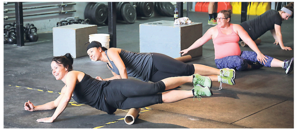
Chaque entraînement commence par un réchauffement de type « Agile 8 », afin de bien préparer le corps.

« C'est plus ça le type de clientèle qui nous intéresse. On change vraiment leur vie », s'émerveille le cofondateur de l'entreprise de Saint-Alphonse.