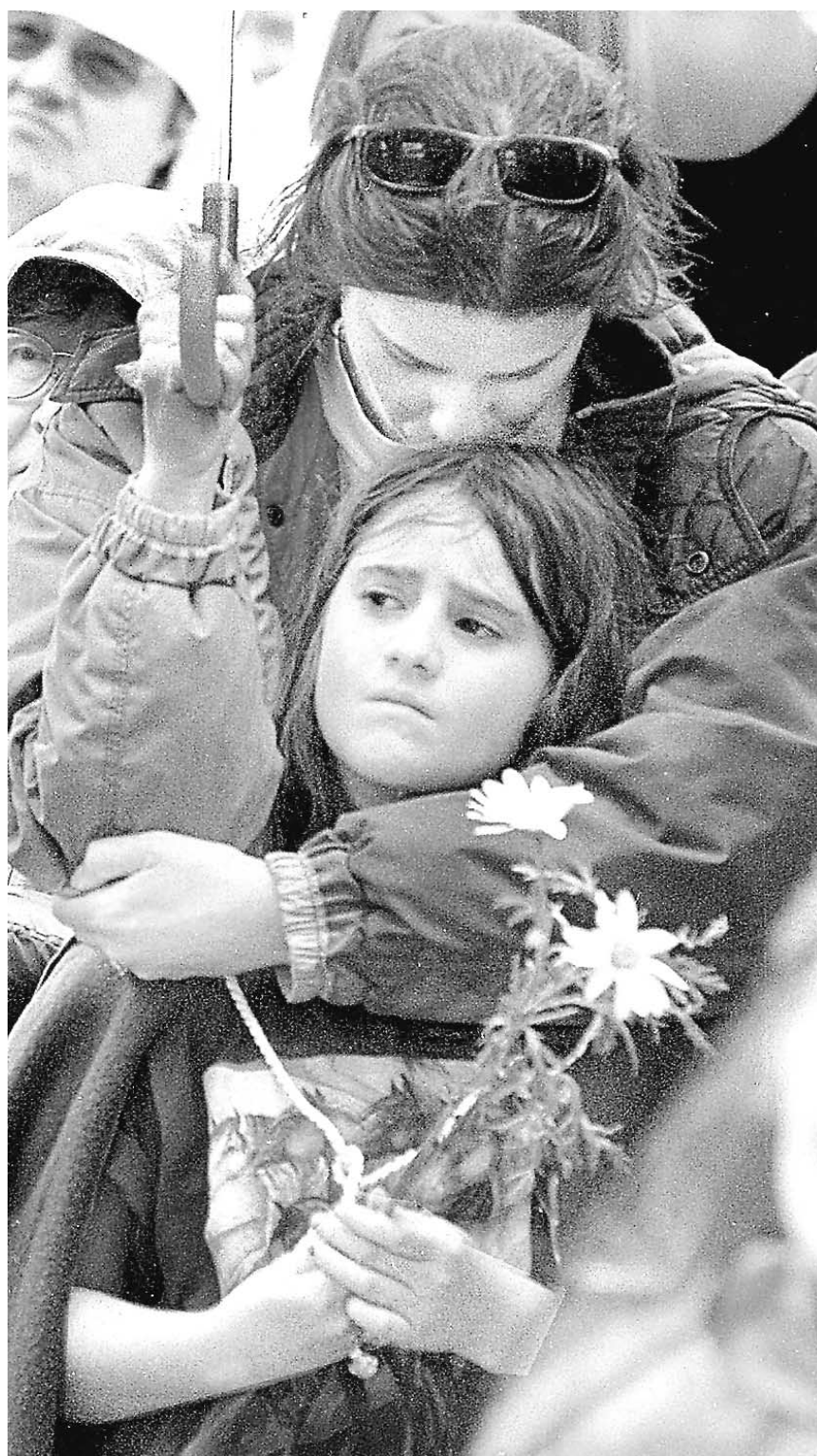
Le 14 mai 2000, des milliers de femmes (et d'hommes) ont marché sur Washington pour exiger un resserrement du contrôle des armes à feu aux États-Unis.