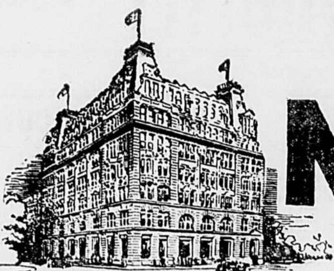
7 MILLBANK, LONDON, ENGLAND