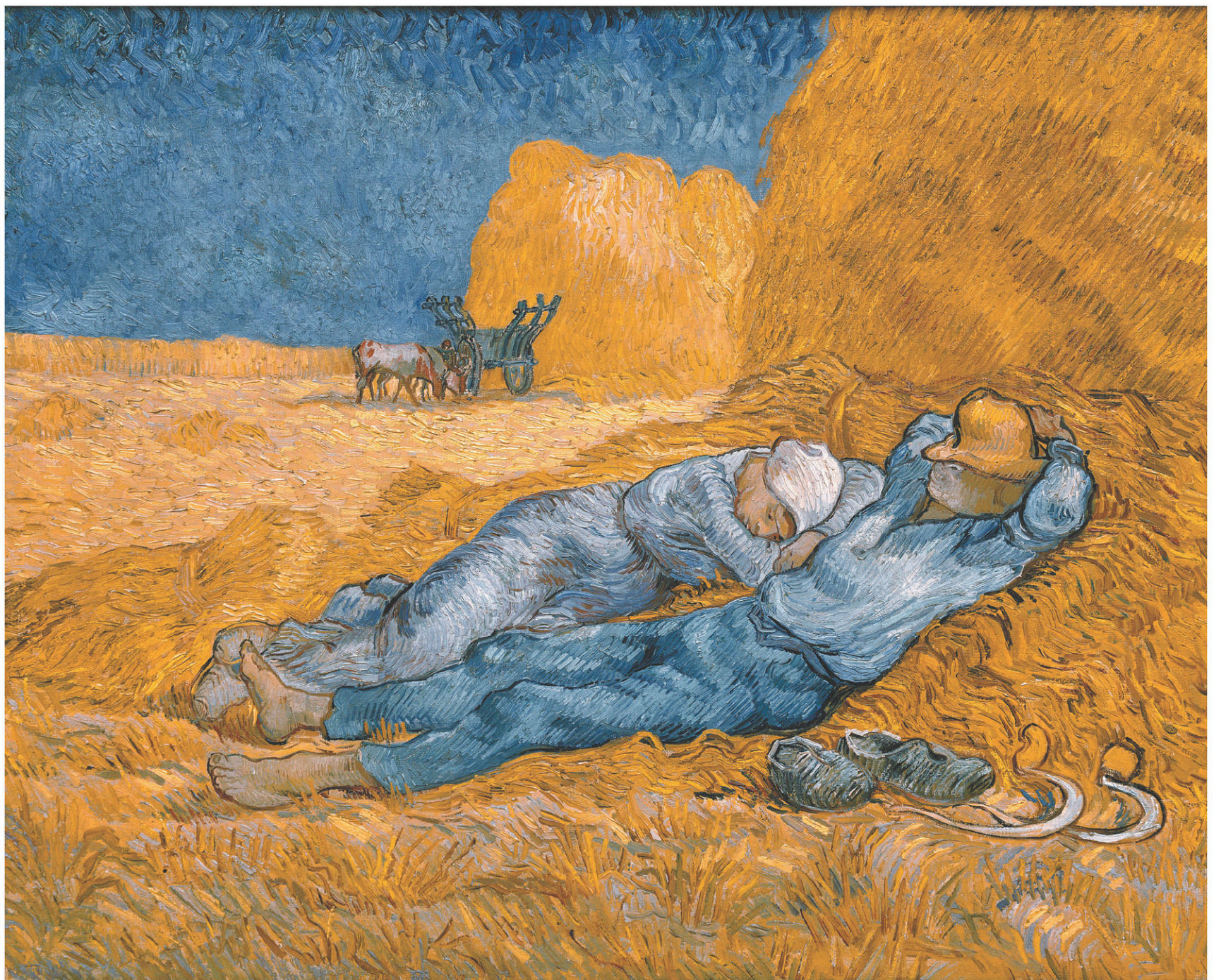
Les représentations artistiques de la sieste sont nombreuses à faire allusion aux controverses que renferme ce moment de repos à l'apparence anodine, comme dans La méridienne ou La sieste (d'après Millet), de Vincent Van Gogh.

Les représentations artistiques de la sieste sont nombreuses à faire allusion aux controverses que renferme ce moment de repos à l'apparence anodine. Le tableau La méridienne ou La sieste de Van Gogh (1890) ne dit pas autre chose. À l'ombre des bottes de paille, elle, ses seuls bras pour oreiller, lui, le chapeau rabattu sur le visage, les postures de ce couple de faucheurs de blé endormi racontent en creux ce qui s'est produit avant que ne soit peint le tableau : une matinée de labeur sous le soleil qui tape, une vie où les temps