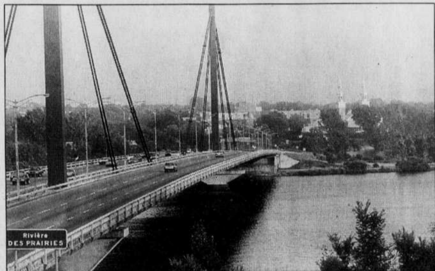
Le pont Papineau-Leblanc reliant Montréal et Laval.