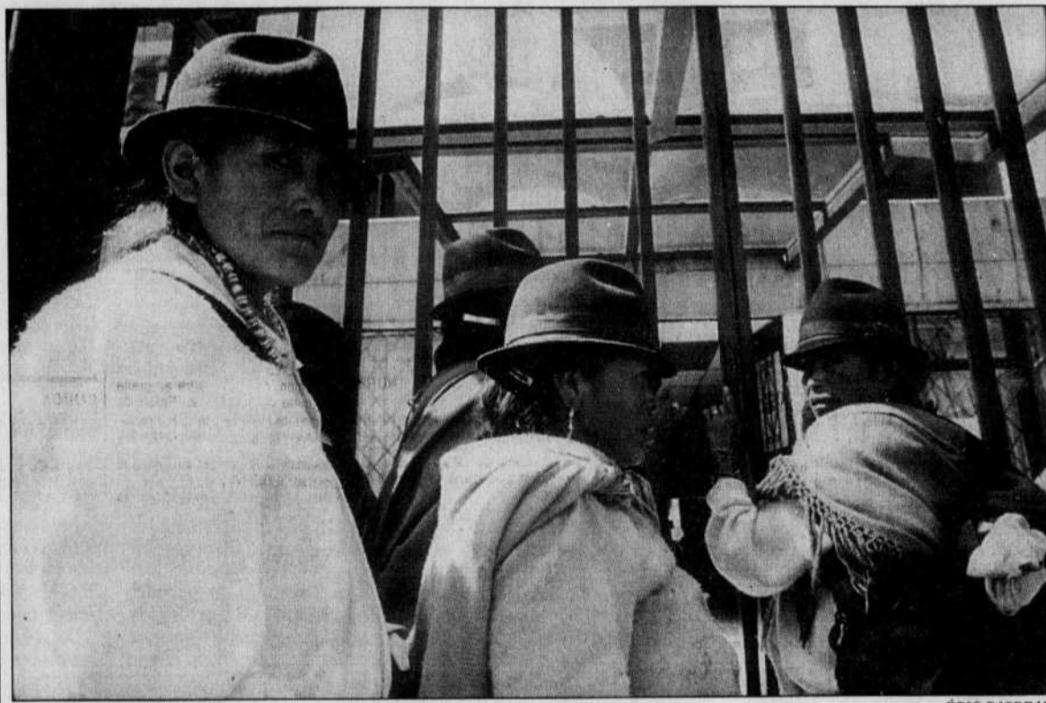
Les autochtones de l'Équateur sont très impliqués dans le mouvement de contestation sociale qui a amené le président Mahuad à décréter l'état d'urgence. Ils ont récemment manifesté devant les locaux du ministère de l'Aide sociale dans la capitale, Quito.