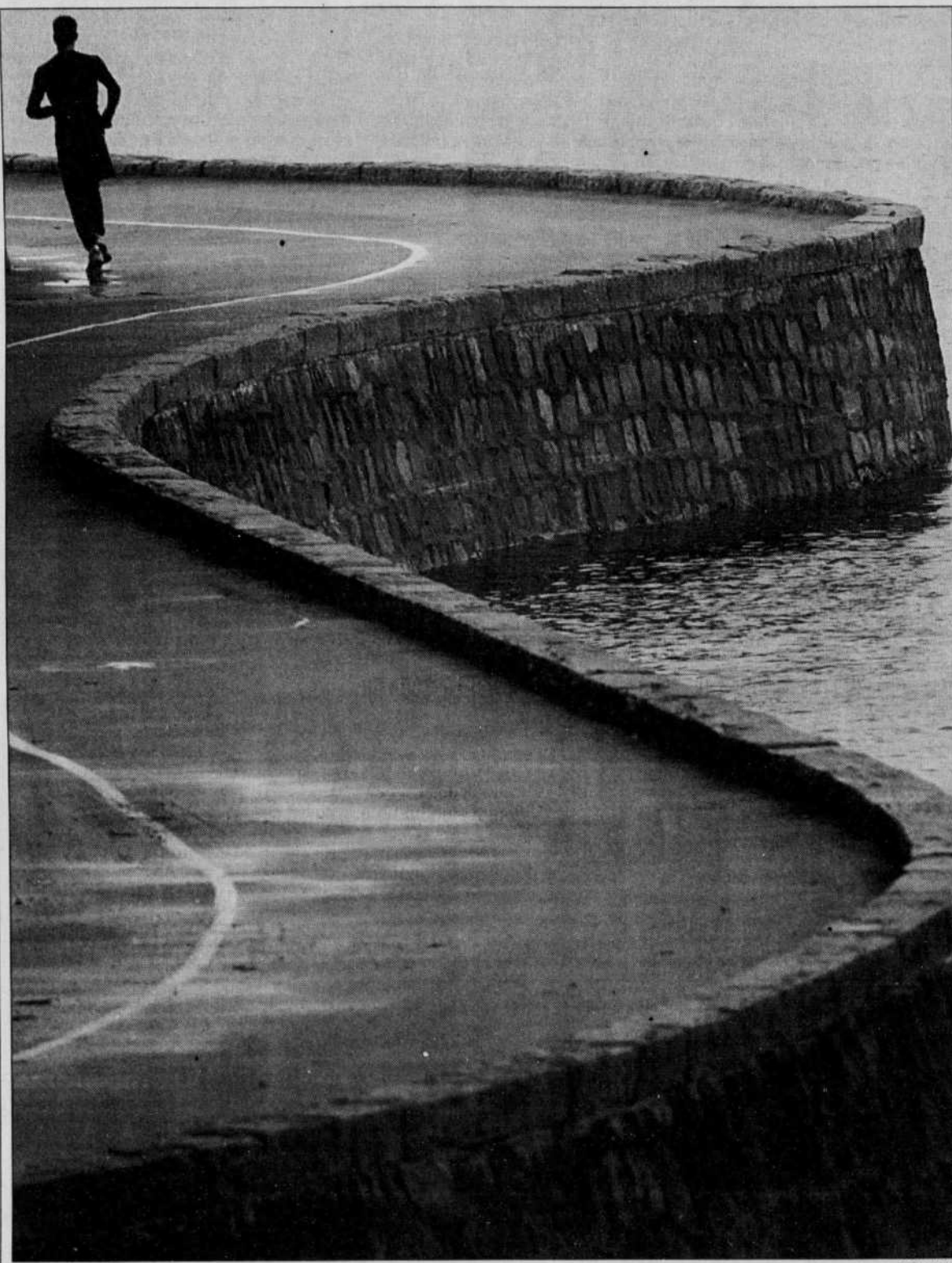
Alors qu'hier le Québec croulait sous la neige, la Colombie-Britannique jouissait d'un temps plutôt clément. À preuve, ce coureur s'offre un charmant parcours sur le bord de l'océan.