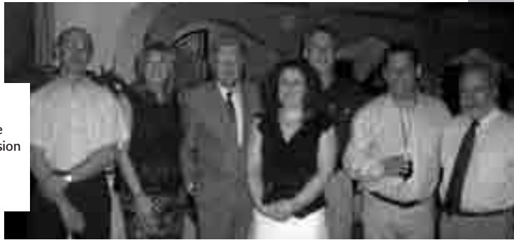
Rencontre de son Excellence Claude Boucher lors d'une mission en Haïti en mars 2007.