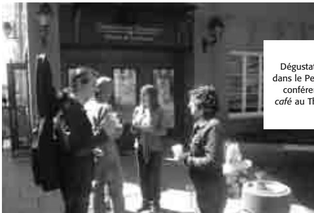
Dégustation de café équitable dans le Petit Champlain lors de la conférence Pour un vrai bon café au Théâtre Petit Champlain.