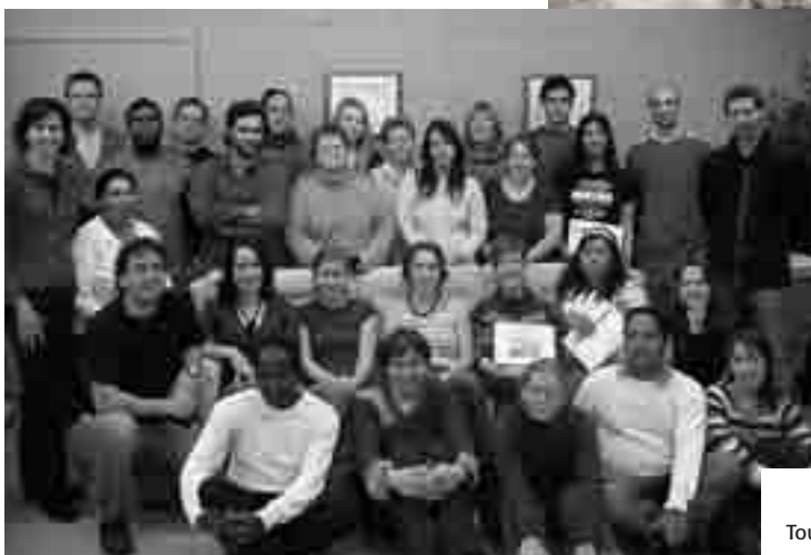
Toute l'équipe de Plan Nagua en compagnie des représentants des organismes partenaires du Sud, en novembre 2006.