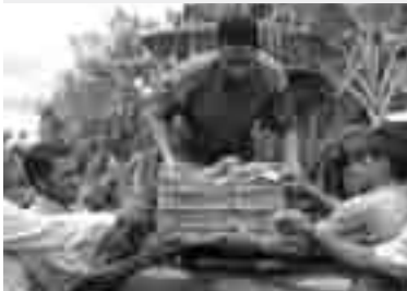
Projet ADEPE : cueillette du fruit le Zapote