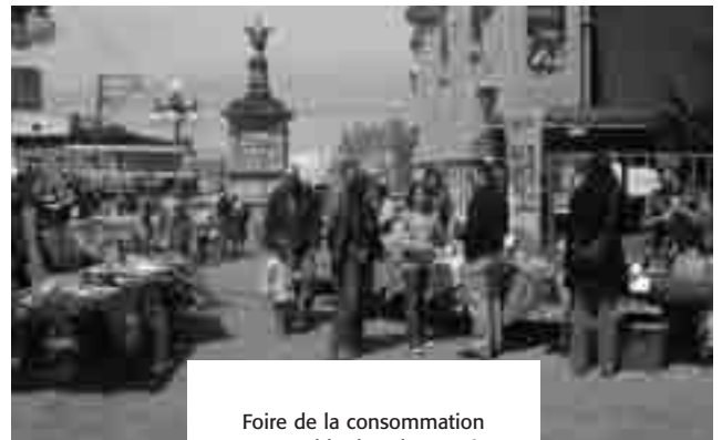
Foire de la consommation responsable dans le quartier St-Jean-Baptiste lors de la Quinzaine du commerce équitable.