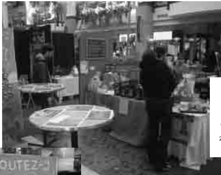
Kiosque lors de l'événement Santé et Environnement de Place Laurier du 26 au 29 octobre 2006.