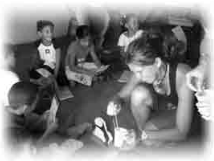
Le groupe Jóvenes en acción 2006, à Nagua, en République dominicaine.