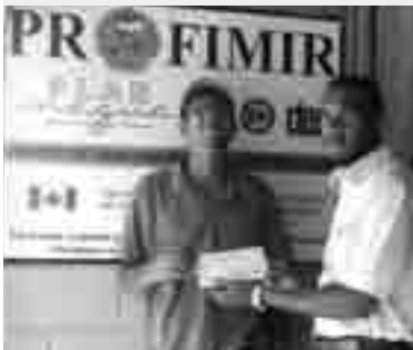
Bénéficiaires du projet Profimir

L'année 2006-2007, soit la dernière année de la programmation triennale 2004-2007 de Plan Nagua, s'est amorcée par quelques événements d'importance en Haïti comme la tenue d'une élection présidentielle en février 2006, qui s'est conclue par l'élection de René Préval et l'espoir formulé par la communauté internationale que ce changement soit accompagné d'une stabilisation de la situation au pays, ce qui, entre autres choses, faciliterait le déploiement des activités de Plan Nagua au pays. Quant à la République dominicaine, il ne s'y est pas produit d'événements politiques aussi marquants, bien que la crise économique persiste et que l'instabilité monétaire causée par la fluctuation du taux de change influence l'attribution des ressources financières.