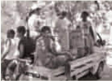
Activité éducative avec les jeunes organisée par la Fondation Máximo Gómez