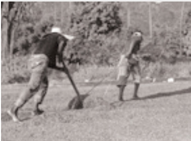
Projet Fedecares : séchage du café

De nombreux succès ont ponctué le premier demi-siècle d'histoire du commerce équitable. Des centaines de milliers de producteurs agricoles et de travailleurs jouissent en effet d'une meilleure stabilité économique, et de très nombreuses collectivités se sont dotées d'importantes infrastructures payées grâce aux primes de commerce équitable.