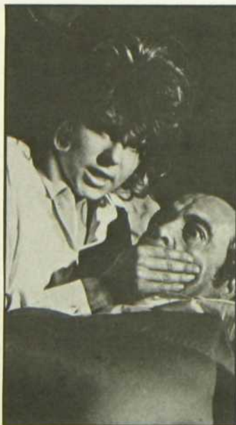
Les diamants sont éternels