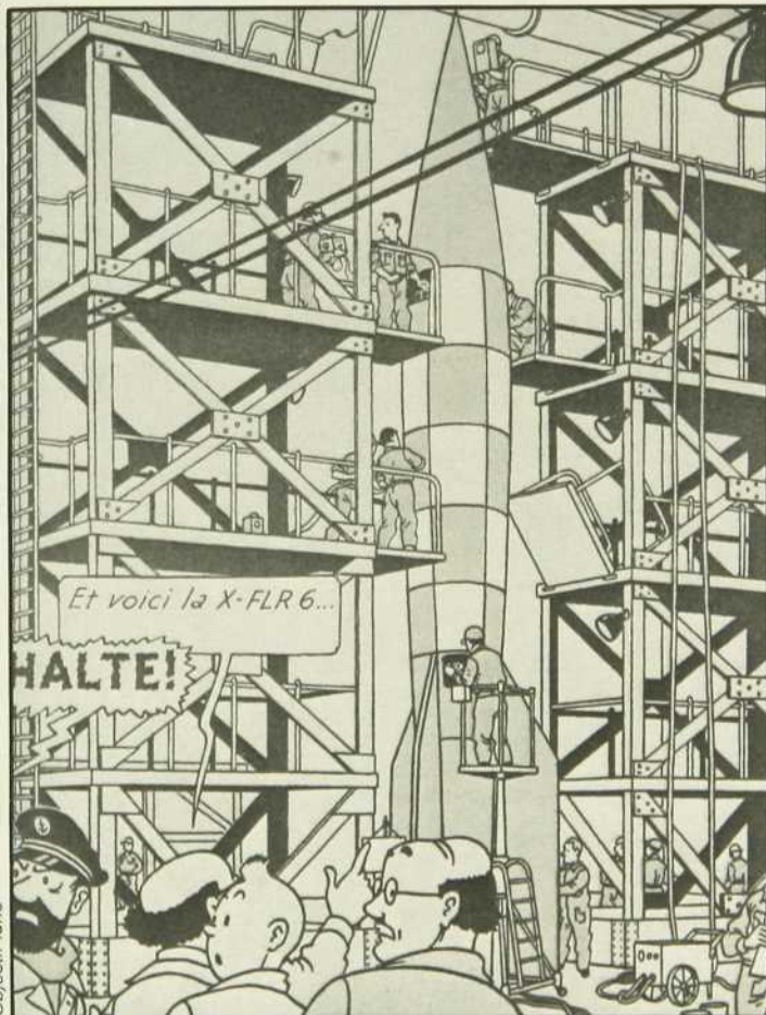
Tintin et les oranges bleues