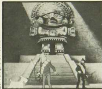
Tintin et le mystère de la Toison d'or