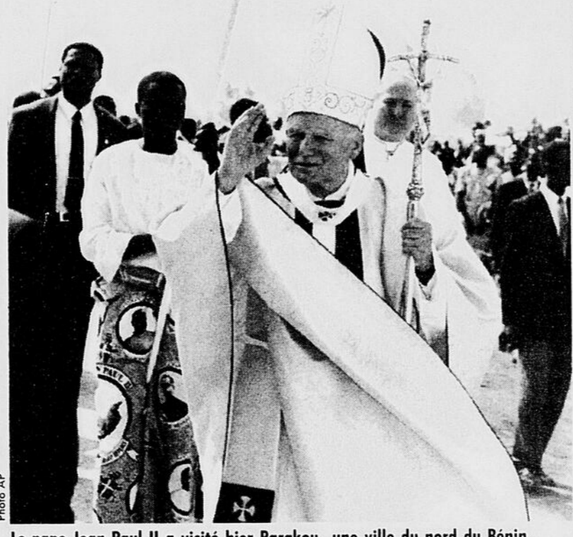
Le pape Jean Paul II a visité hier Parrakou, une ville du nord du Bénin.

Le pape devait retourner à Cotonou hier soir. Il s'envolera pour l'Ouganda aujourd'hui. Dans ce pays, la police et l'armée ont pris des mesures de sécurité exceptionnelles.