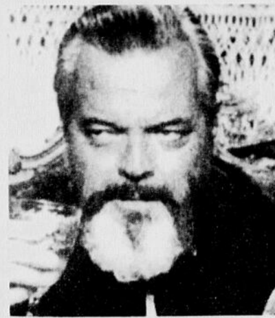
Charlie Chaplin et Orson Welles ont tourné dans quelques films cotés 1.

troublantes aux jeunes gens. Le clergé canadien-français n'aimait pas que des jeunes de sexe différent puissent se retrouver dans la même salle, plongée dans l'obscurité.