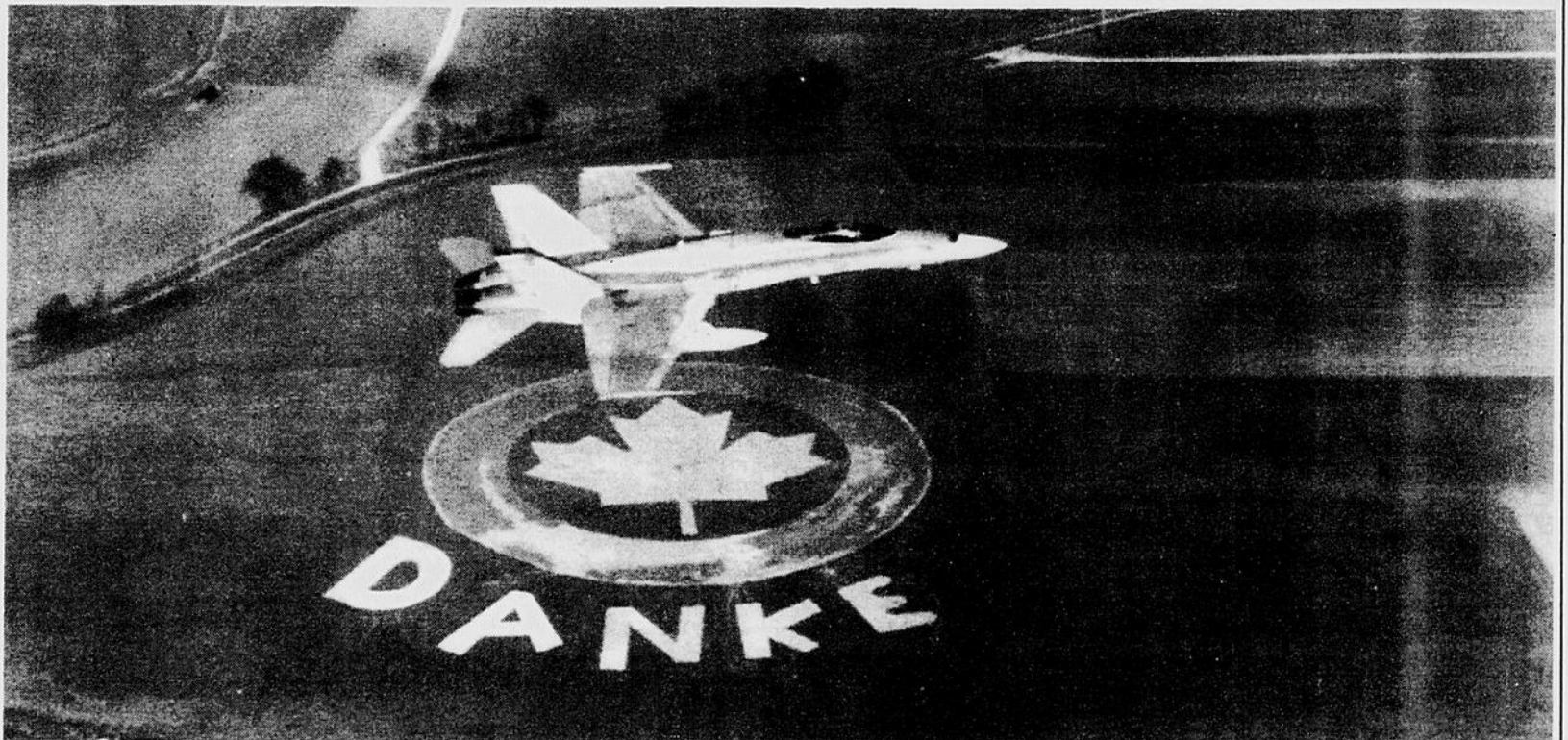
Un CF-18 canadien vole au-dessus d'un champ, près de la base de Baden-Soellingen, en Allemagne, où un résident a inscrit un message — le mot «Merci — aux soldats qui quittent la base militaire».

«Notre départ aura un impact profond sur la région car nous employons environ 700 Allemands sur nos deux bases et injectons 400 millions de dollars par année dans l'économie locale.»