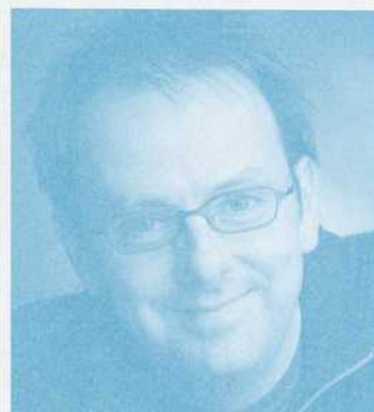
BENOÎT VERMEULEN MISE EN SCÈNE ET COLLABORATION AU TEXTE