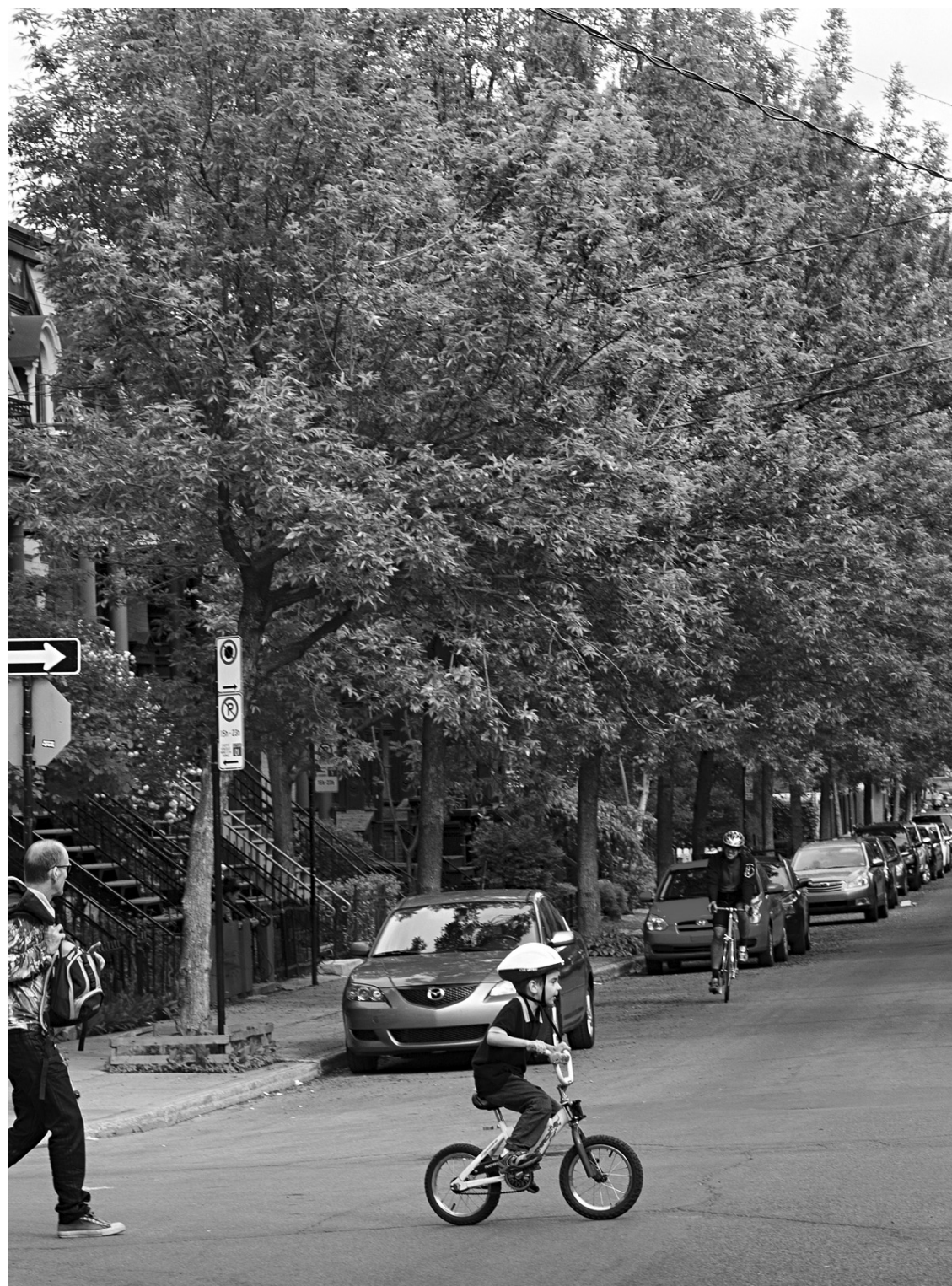
Les 375 000 arbres sont prévus en plus des efforts de remplacement des frênes frappés par l'agrie.

Les prochains Jours de la Terre seront une occasion de relancer le projet, de réanimer la mobilisation citoyenne pour arriver au point culminant du 22 avril 2017. D'ailleurs, Astral Affichage et les nombreuses chaînes radio d'Astral sont partenaires et diffuseront une grande campagne publicitaire chaque année d'ici le 22 avril 2017. Pour clore le projet, le