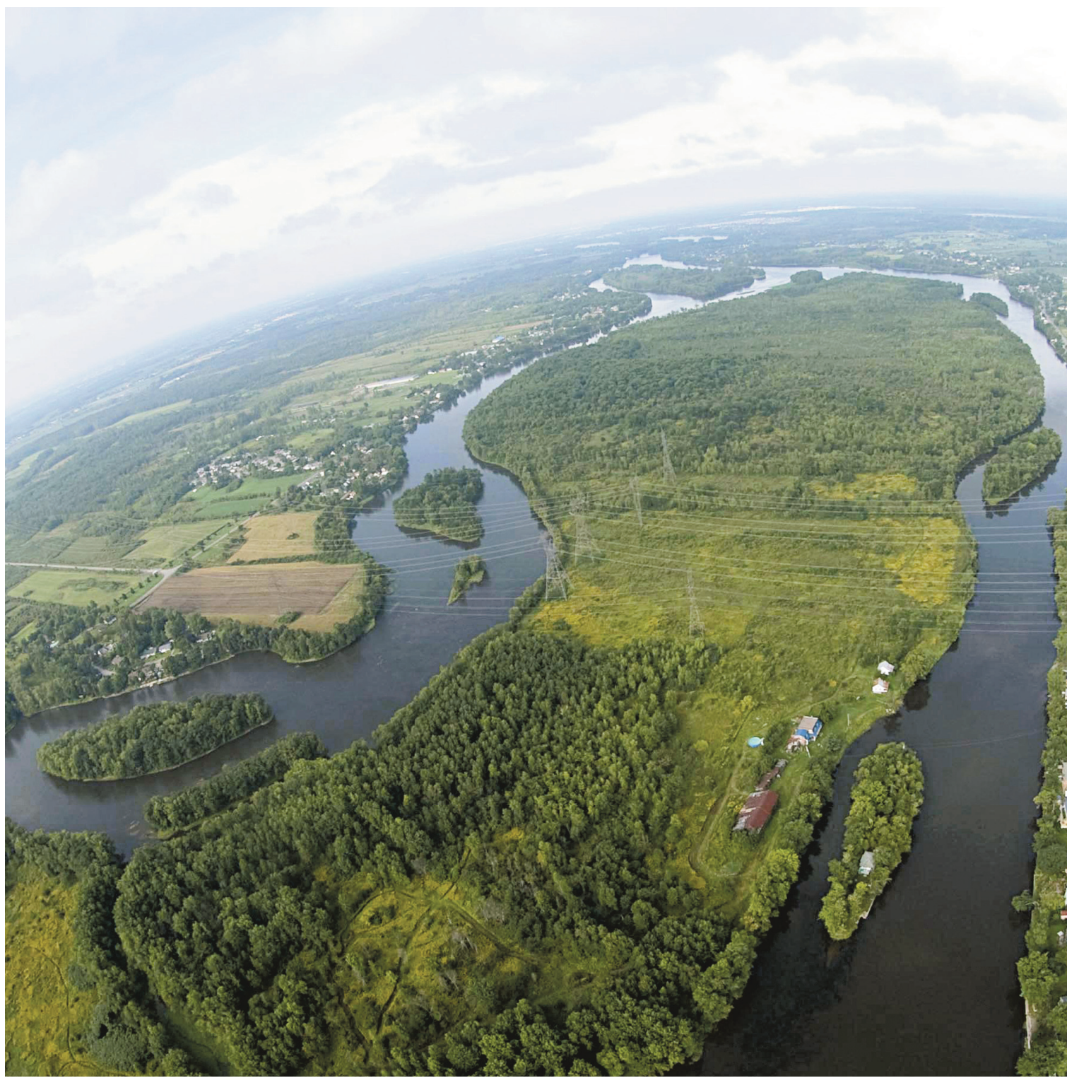
Le parc de la rivière des Mille-Îles fait partie des cinq projets en cours orientés vers la TVB, aux côtés entre autres d'un axe cyclable reliant Oka à Mont-Saint-Hilaire.