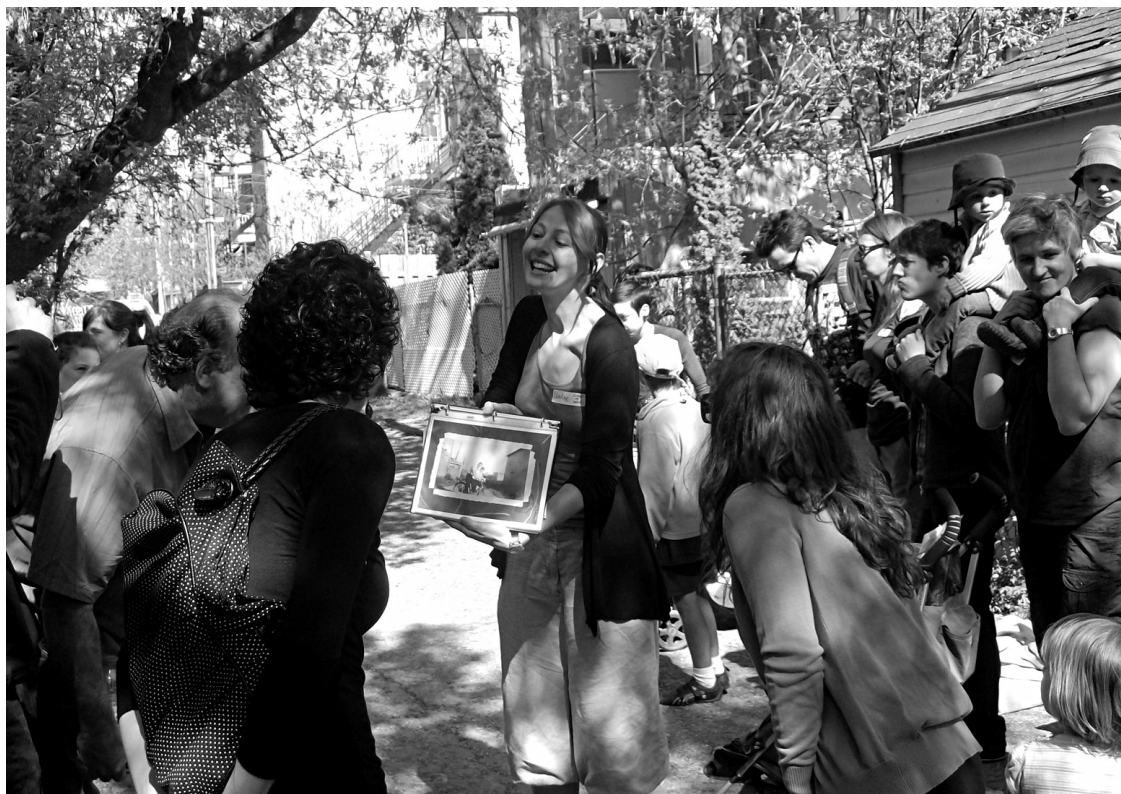
Le CEUM chapeaute une série de marches, dites «Promenades de Jane», organisées par des citoyens afin de faire découvrir différents aspects de la ville.

Le Centre n'est pas pour autant «antivoiture». «En fait, nous sommes pour le partage de la rue», indique M me Rocheleau. On comprend qu'il y a des gens qui ont besoin de se transporter en voiture, mais il faut aussi tenir compte du fait