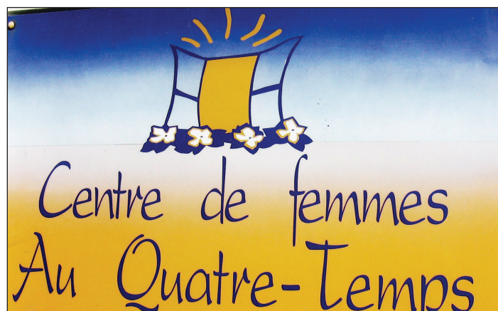
Centre de femmes à Alma

Il est prévu que la création artistique issue de cette rencontre sera publiée dans un recueil des projets féministes du Regroupement des Centres de femmes qui tiendra son Congrès annuel en juin 2014. La découverte de «L'Utopie» et d'autres créations artistiques sera, pour les femmes, comme un pont