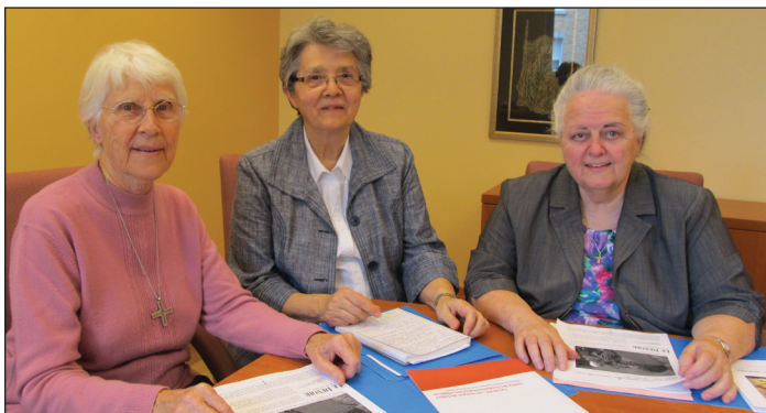
Québec, 20 avril 2013

Une rencontre de solidarité avec des représentantes d'une quinzaine de groupes de femmes, dont quelques membres de l'ARDF de Québec, s'est tenue le 20 avril 2013. Le réseau Femmes et ministères a voulu que cette journée de réflexion soit une contribution utile aux États généraux de l'action et de