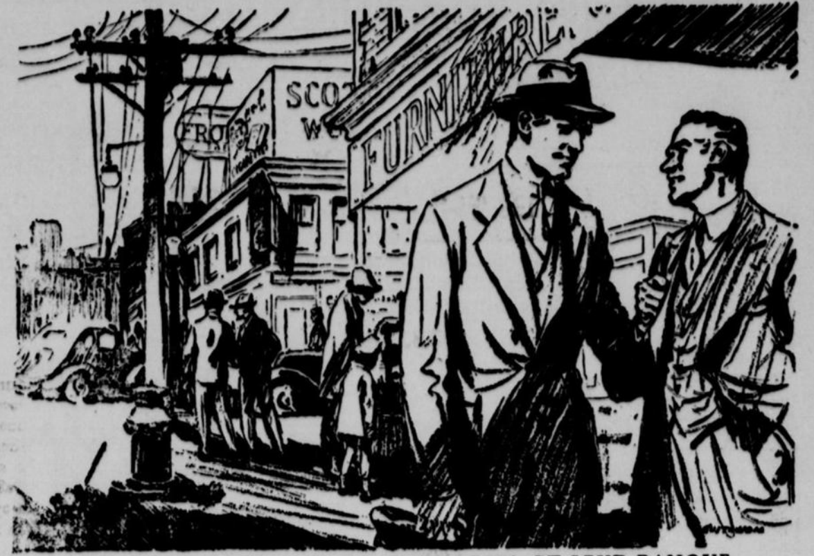
LES CANADIENS ET LEURS INDUSTRIES—ET LEUR BANQUE

—Celui qui demande sans rougir ne trouve rien de mortifiant dans le refus. — Thurelon.