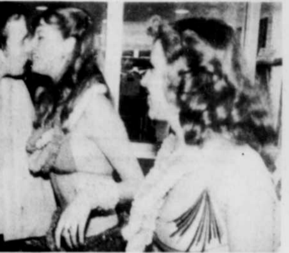
C'est un groupe de danseuses vêtues à la hawaïenne qui ont accueilli, mercredi, à l'aéroport de Winnipeg certains délégués qui débarquaient pour le congrès conservateur.