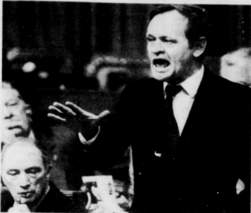
Le ministre de l'Énergie Jean Chrétien s'est lancé dans une attaque virulente contre le premier ministre de Terre-Neuve Brian Peckford, hier, aux Communes.