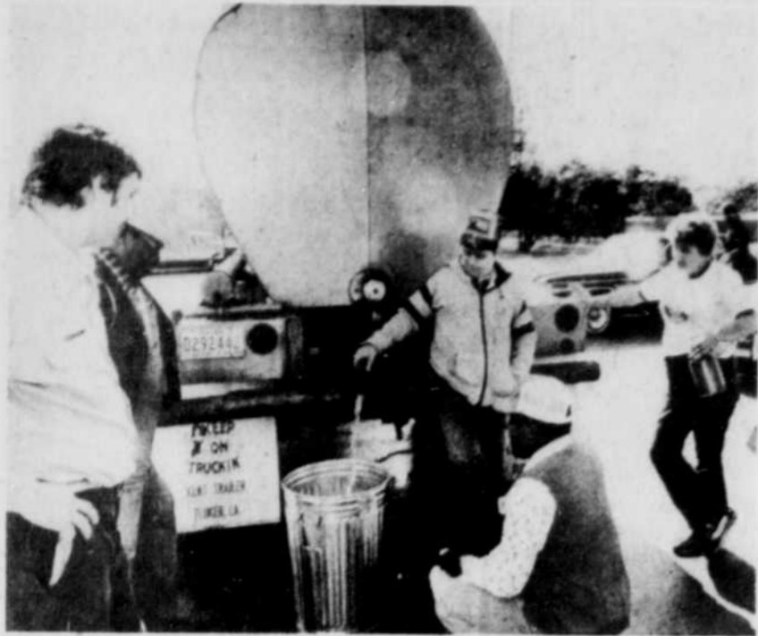
Les résidents de Hammond, Louisiane, n'auront plus à faire la queue devant un camion pour avoir de l'eau, l'alerte au cyanure étant maintenant une histoire résolue.