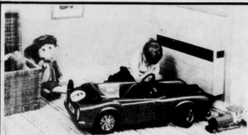
Le convecteur "antichocs" électronique à structure particulièrement robuste est recommandé pour la chambre d'enfants.

Arts et divertissements Petites annonces