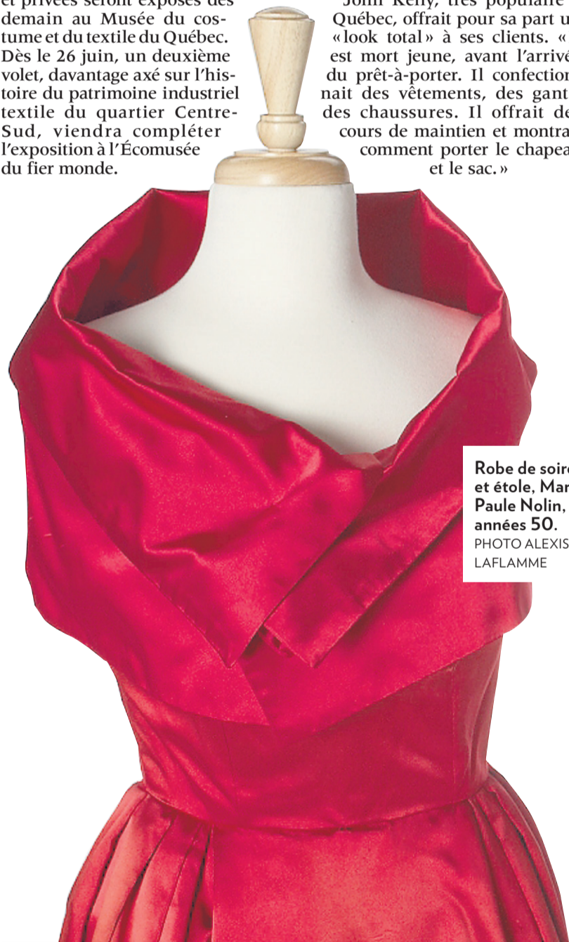
Robe de soirée et étole, Marie-Paule Nolin, années 50. PHOTO ALEXIS K. LAFLAMME

Robe de soirée, Arnold Scaasi, 1987. PHOTO ALEXIS K. LAFLAMME