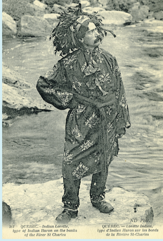
Indien de Lorette, 1907.