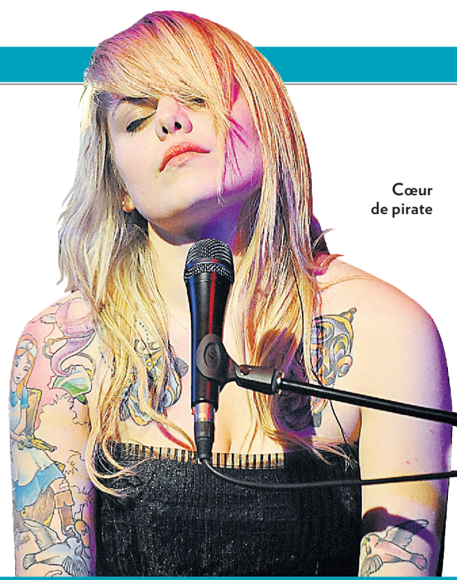
Cœur de pirate