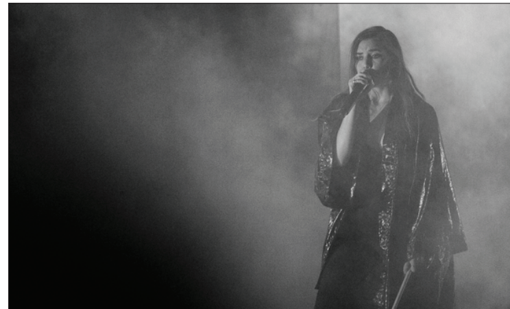
La suédoise Lykke Li

Le festival Osheaga offre une grande diversité de genre de musique. En passant par le rap, le reggae à l'électro et l'indie-rock, il est certain que vous trouverez de quoi vous plaire. La scène PiknicÉlectronik a éclaboussé plusieurs danseurs; les pieds dans l'eau qui les arrosaient un peu plus tôt. C'est d'ailleurs la seule scène qui jouait sans arrêt de 1h00 à 11h00. De plus, le site est vraiment dans l'ère de la technologie avec un poste de recharge de téléphones