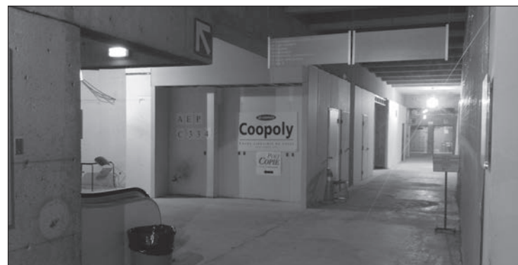
L'état d'avancement des travaux cette semaine.