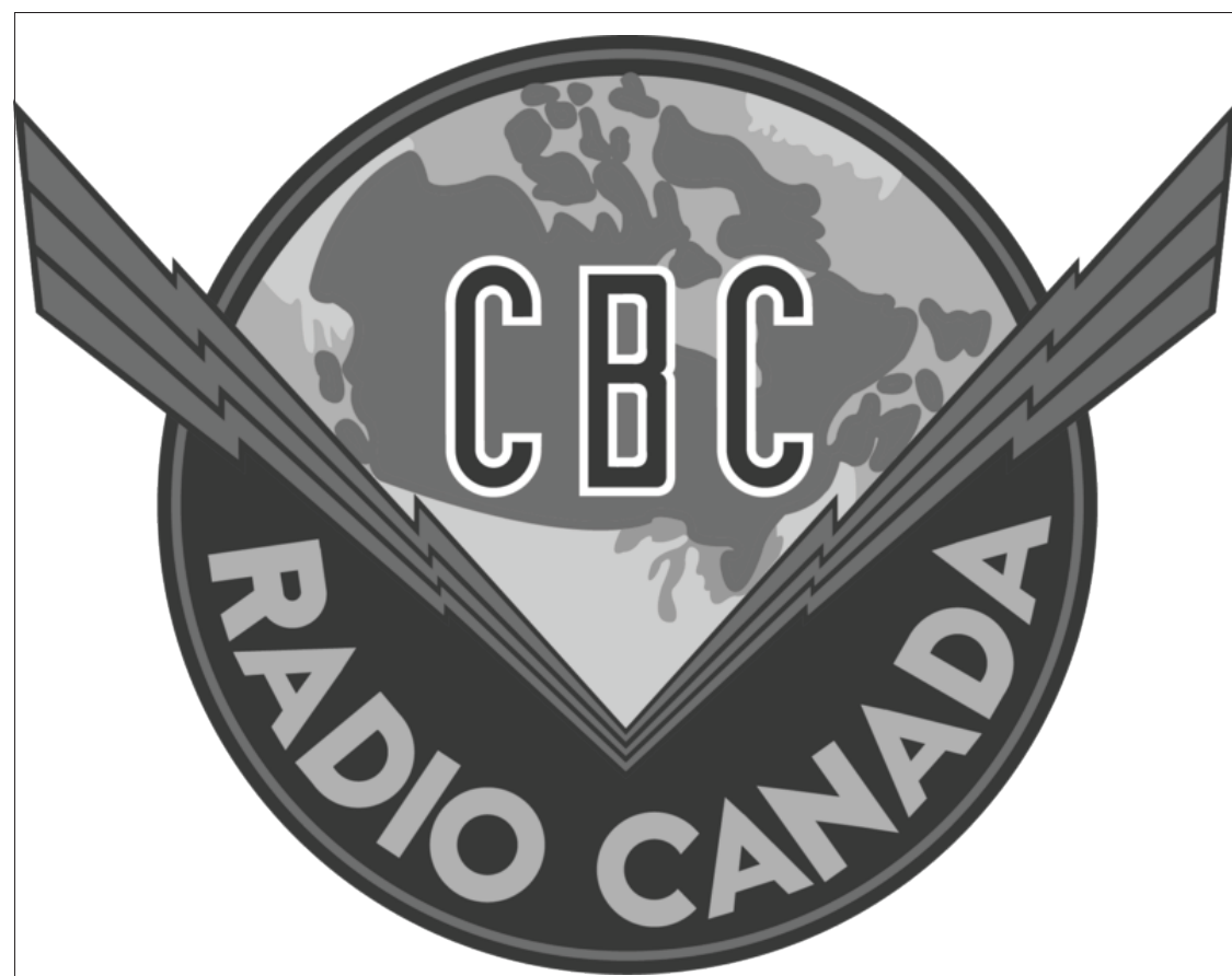
Le premier logo de Radio-Canada en 1940 après 4 ans d'existence.

J'ai l'impression que notre capacité à avoir une opinion politique dépend grandement de l'accès que nous avons à l'information et qu'il est plus facile de diriger un peuple qui ne suit pas l'actualité. Si l'essentiel de la population n'est pas en contact avec les problèmes nationaux et internationaux, il est plus facile de faire accepter des décisions comme les achats d'armes, la diminution des espaces protégés, l'augmentation des peines pour les criminels mineurs. Alors, non seulement les conservateurs donnent l'impression de se venger en coupant les subventions aux médias, mais en plus, ils s'assurent un contrôle plus ferme du peuple. C'est le contrôle par l'ignorance.