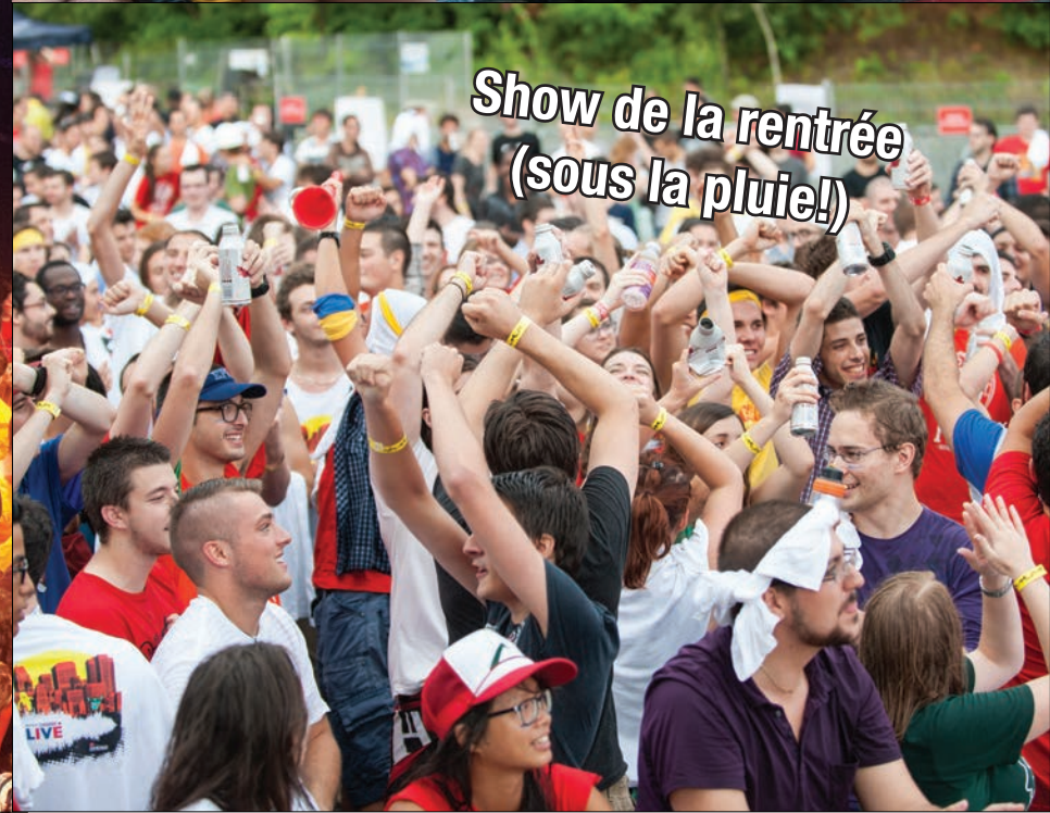
Show de la rentrée (sous la pluie!)