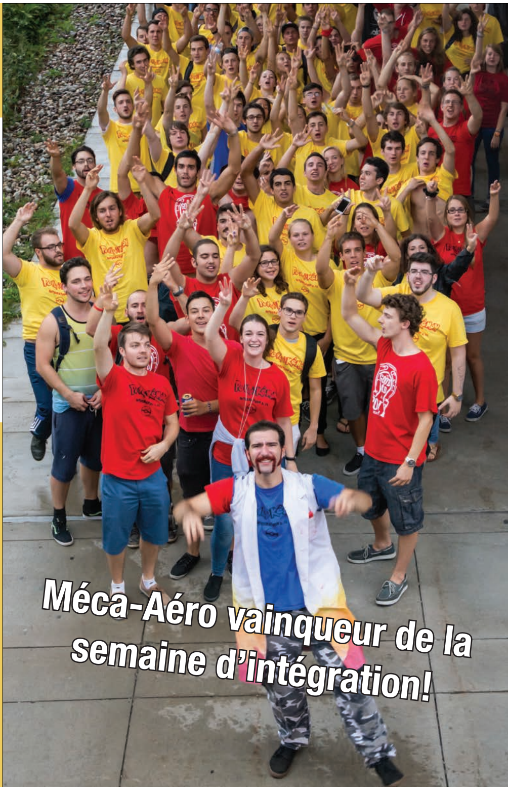
Méca-Aéro vainqueur de la semaine d'intégration!