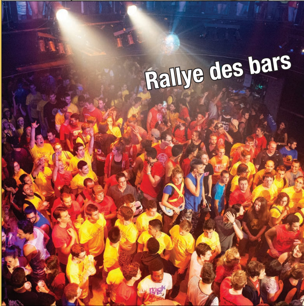
Rallye des bars