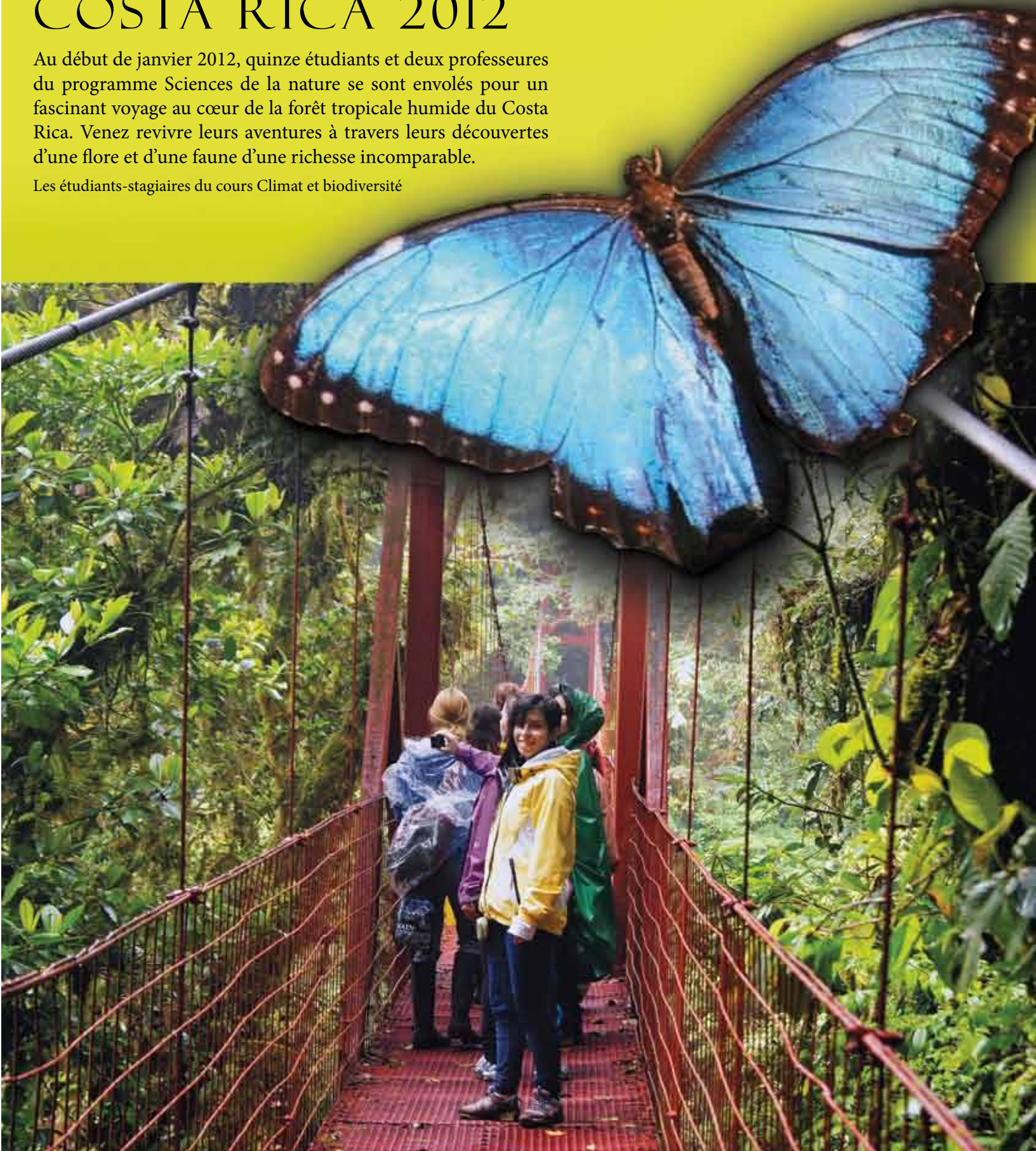
Parc National de Monteverde — Papillon Morpho

Les étudiants-stagiaires du cours Climat et biodiversité