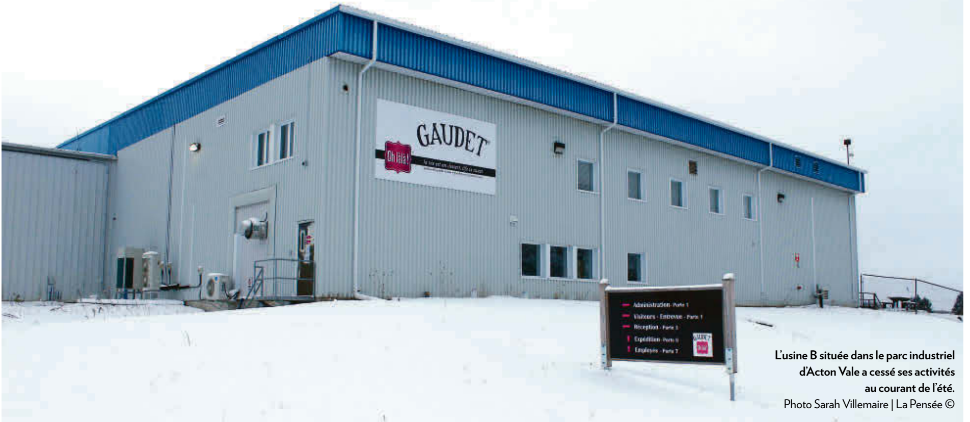
L'usine B située dans le parc industriel d'Acton Vale a cessé ses activités au courant de l'été.