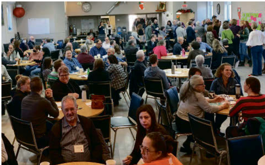
Quelques 140 intervenants ont participé à la Journée des partenaires organisée par la MRC du Val-Saint-François, le 12 décembre.

Rappelons que la démarche se poursuivra à travers une consultation publique accessible sur le site Internet de la MRC du 22 décembre 2022 au 16 janvier 2023. Pour toutes questions concernant la démarche, il est possible de contacter le comité de suivi en écrivant à communications@val-saint-francois.qc.ca .