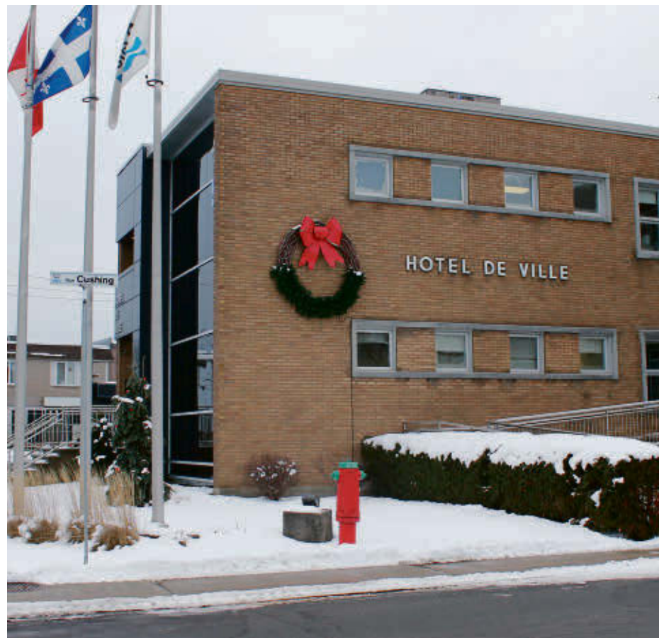
Les conseillers municipaux de la Ville d'Acton Vale ont adopté à l'unanimité le budget 2023 présenté en séance extraordinaire le 19 décembre.

Outre les projets de réfection de quelques rues, l'amélioration d'infrastructures fera une fois de plus partie des priorités de la Ville pour la prochaine année. Comme mentionné dans le programme triennal d'immobilisations, le prolongement de la rue Bernier d'un montant de 700 000 $ figure à l'agenda 2023. La réfection de la toiture et du bâtiment de la bibliothèque municipale est aussi dans les cartons avec un investissement de 580 000 $. L'achat d'une nouvelle surfaceuse pour le Centre sportif d'Acton Vale, pour un montant de 200 000 $, fait aussi des principaux investissements de la Municipalité pour l'année à venir.