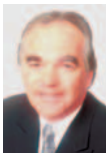
Dear Fellow Citizens,