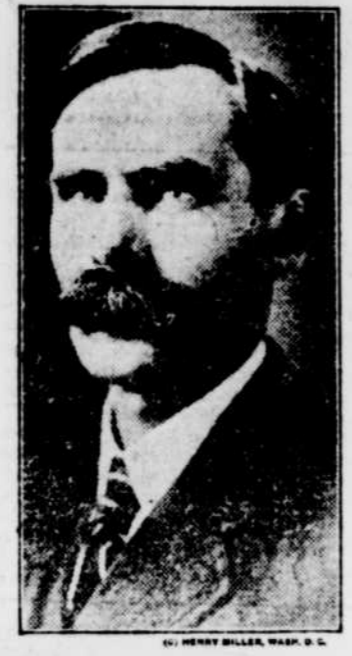
Andrew J. Volstead, le père de la loi Volstead, qui vient d'admettre que les Etats-Unis ne seront jamais prohibitionnistes. Il affirme que toutes les lois sont violées et celle de la prohibition n'y échappe pas.