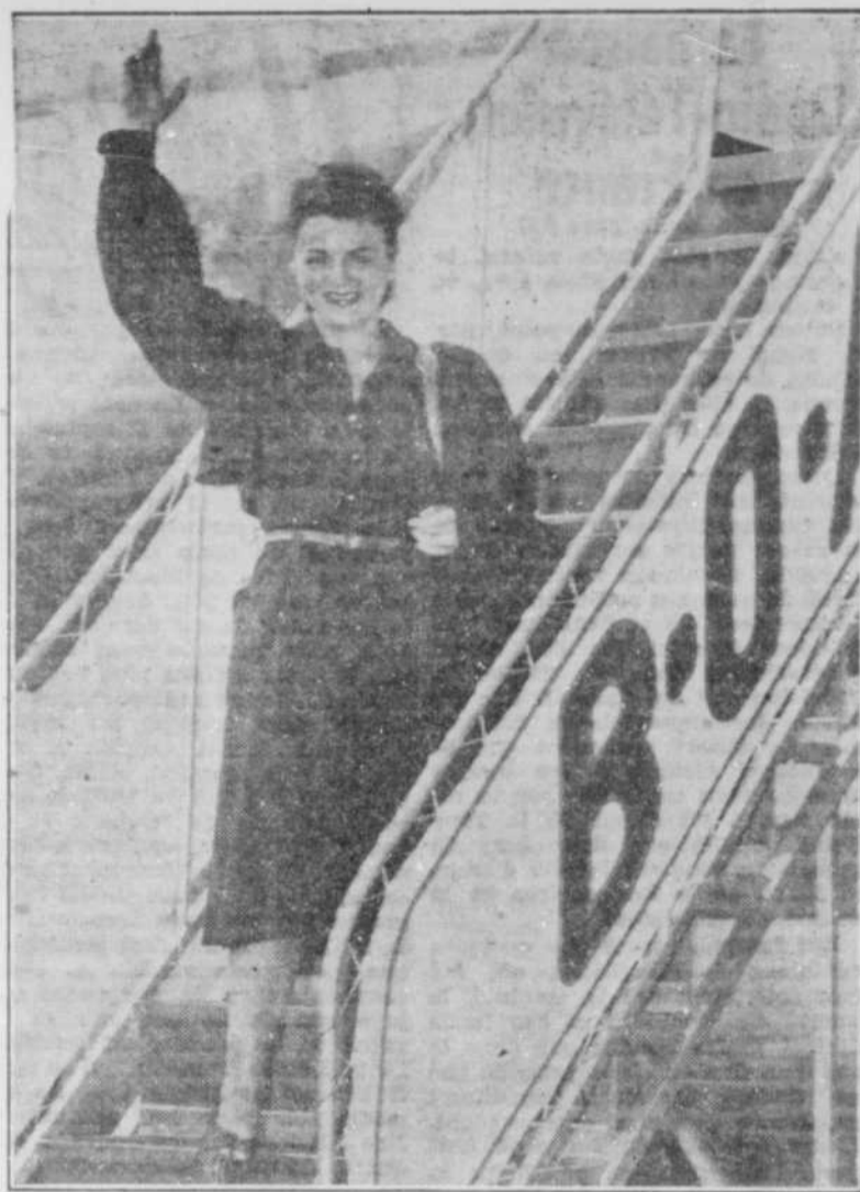
ALYS ROBI, qui vient de remporter un succès retentissant en Angleterre, est débarquée cette semaine en France, poursuivant sa tournée. L'étoile du programme "Prix d'héroïsme" a été vivement applaudie au café La Martinique à Brighton, la villégiature célèbre et la BBC l'a engagée pour une série de programmes de télévision.

"ET PUIS APRES ?" sera dorénavant commandité et entendu une fois la semaine, le MERCREDI, de 7 h. 45 à 8 heures, à compter du 27 août.