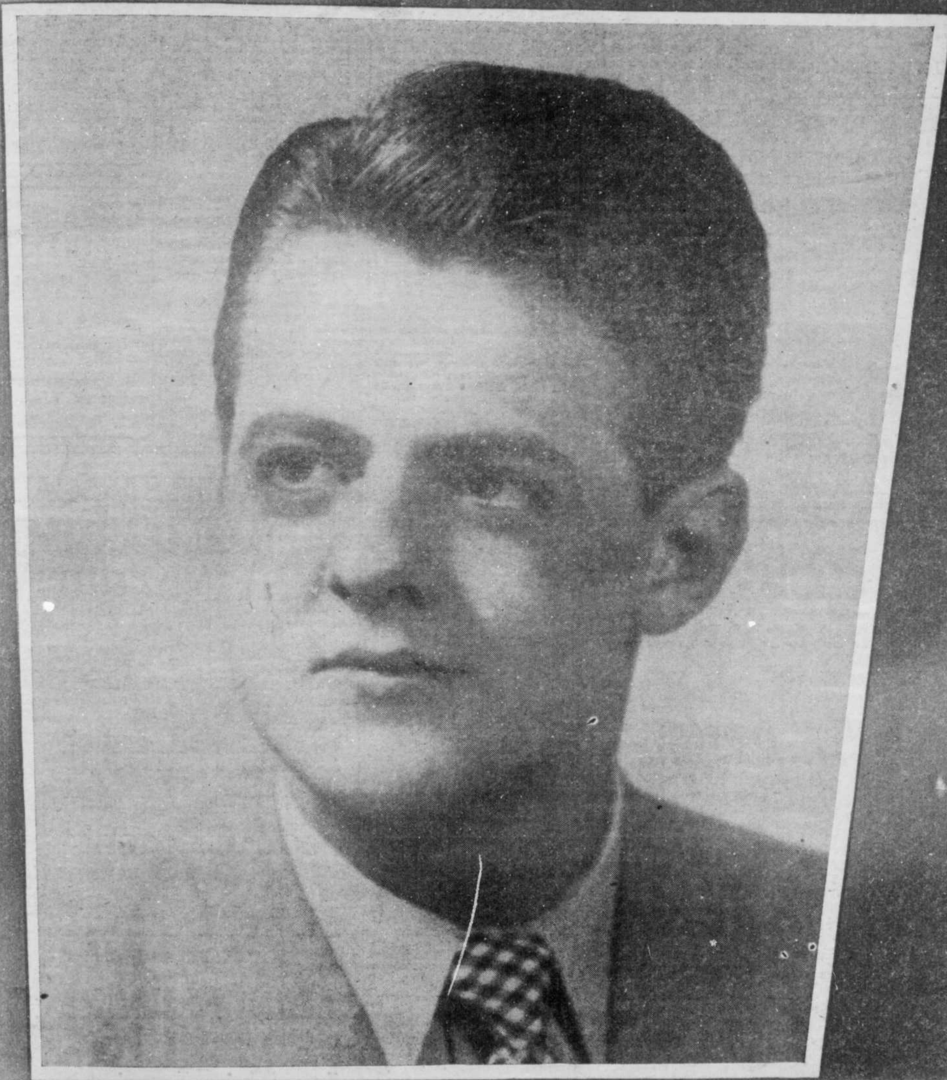
PIERRE BOUTET TÉNOR