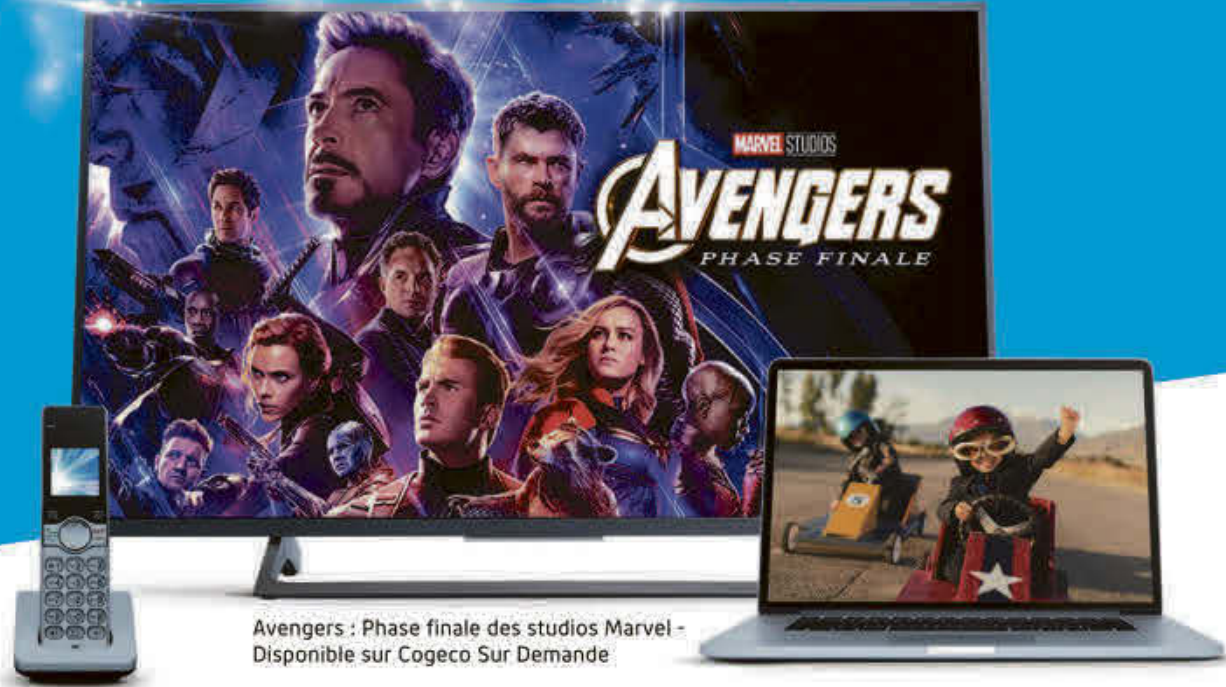
Avengers : Phase finale des studios Marvel - Disponible sur Cogeco Sur Demande

Vitesse Internet ultra-rapide • Wi-Fi puissant Télé flexible • Service à la clientèle local