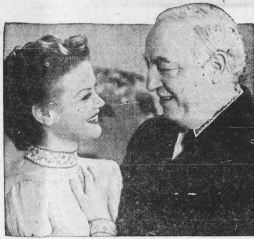
Simon, Simon et Harry Baur dans le film "Les Yeux noirs", qui prendra l'affiche au Saint-Denis.