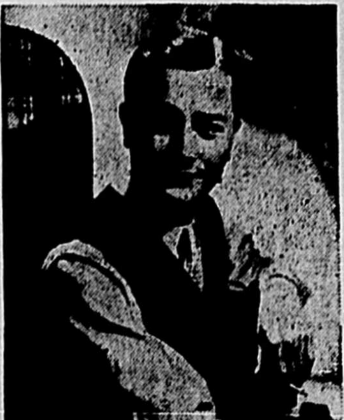
Robert Young held a wide variety of jobs before settling down to a career of acting. He was a drug clerk, reporter, building and loan salesman and bank clerk prior to the time he joined a stock company on the Pacific Coast. Today, Robert Young is completing his fifth motion picture role in "The Shining Hour."