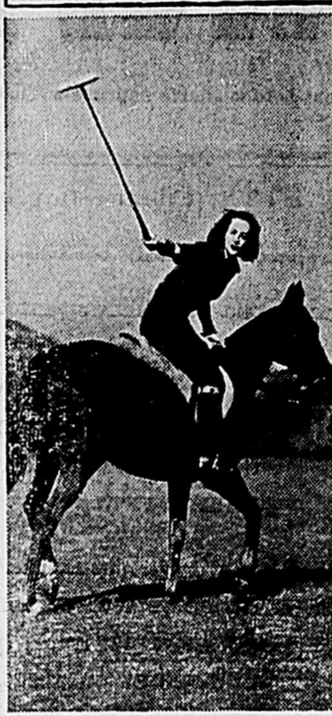
Mounted on her favorite pony, "Sweetheart", Joan Crawford enjoys an hour of relaxation by playing polo. When not before the camera, Miss Crawford spends her spare time on the polo fields near her Brentwood Heights home.