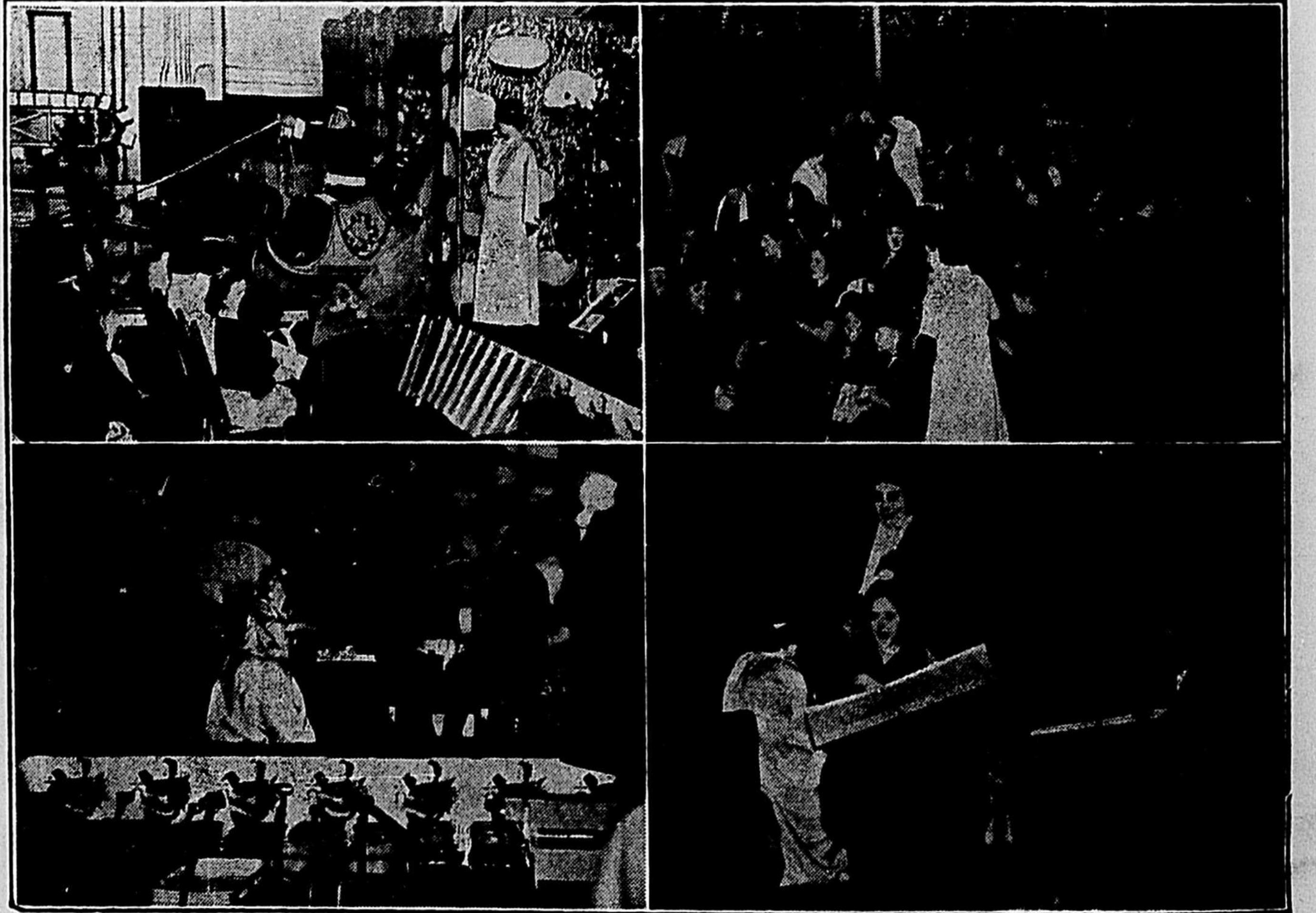
En haut à gauche — L'arrivée du Père Noël dans un traîneau construit par un employé. En bas à droite — Une partie de la foule. En bas à gauche — La distribution des cadeaux par le Père Noël et la Fée des Etoiles. En bas à droite — Une "petite" demoiselle et un "gros" cadeau.

Plus de trois cents enfants, âgés de moins de douze ans, participèrent samedi après-midi à une fête organisée en leur honneur par les employés de la Brasserie Frontenac, à laquelle tous les membres du personnel — mariés ou non — avaient contribué financièrement, par versements mensuels, depuis le mois de juin dernier, assurant ainsi un cadeau à chaque enfant présent. Les décors, le traîneau du Père Noël et la plateforme érigée à cette fin avaient été construits par les employés eux-mêmes, qui firent preuve d'un magnifique esprit-de-corps, et cette fête qui eut lieu dans la salle d'emballage de la brasserie remporta un vif succès.