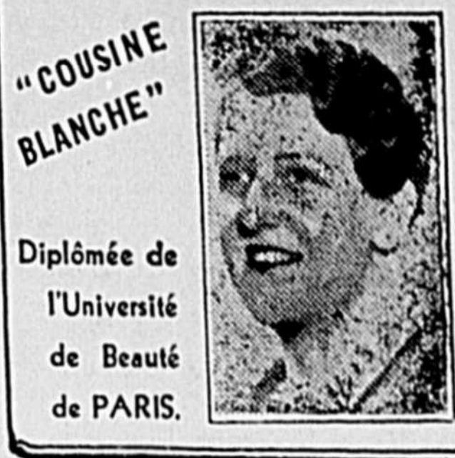
La beauté à bon compte

Je sais qu'il est des femmes qui consacrent des sommes extravagantes à soigner "leur beauté". Je sais qu'il est de petits bœufs de crèmes pseudo-miraculeuses qui sont sensées rajeunir une femme en deux ou trois applications... et que pour une telle transformation, Faust n'a pas hésité à vendre son âme au diable. Il n'est donc pas surprenant qu'on demande des cinq dollars pour de telles crèmes... malheureusement celles qui en font usage sont déçues. On ne saurait transformer son apparence du jour au lendemain. Celles qui croient le contraire méritent qu'on les exploite.