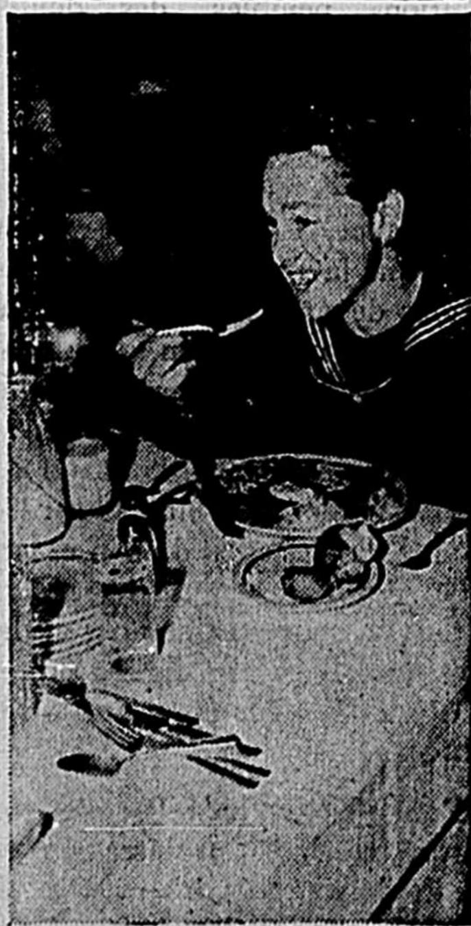
Voici, cutlet à la Holstein la luncheon favorite of Mickey Rooney. The cutlet is dipped in egg and cracker crumbs and fried; a fried egg garnishes the top with a slice of beet and anchovies on the side. Fresh lima beans are the vegetable; milk, the beverage.