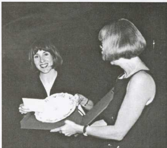
Cadeau remis à la présidente