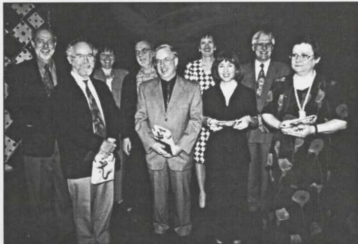
Les anciens présidents