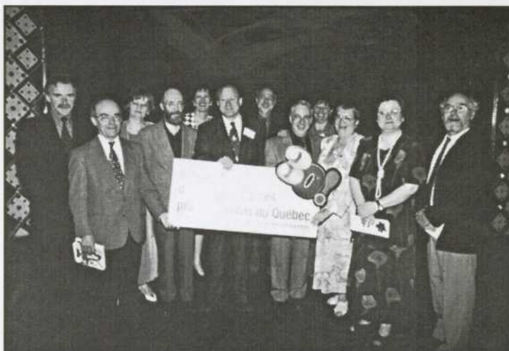
Les membres les plus actifs des comités