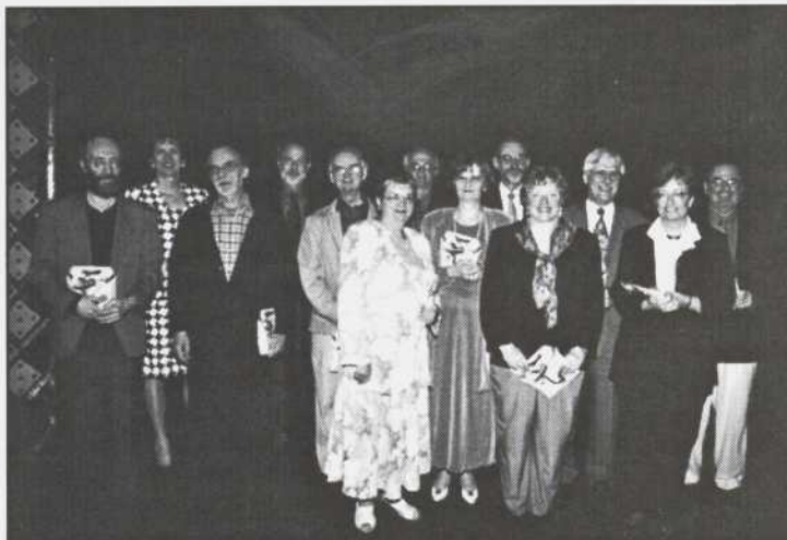
Les membres fondateurs