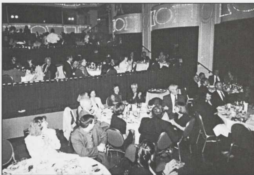
La soirée au Caf' Conc'