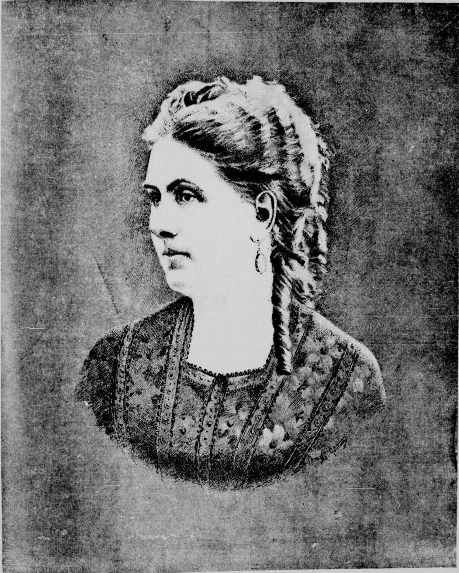
MADAME FELIX FAURE, FEMME DU PRÉSIDENT DE LA RÉPUBLIQUE FRANÇAISE

La ligne, par insertion - - - - 10 cents Insertions subséquentes - - - - 5 cents Tarif spécial pour annonces à long terme