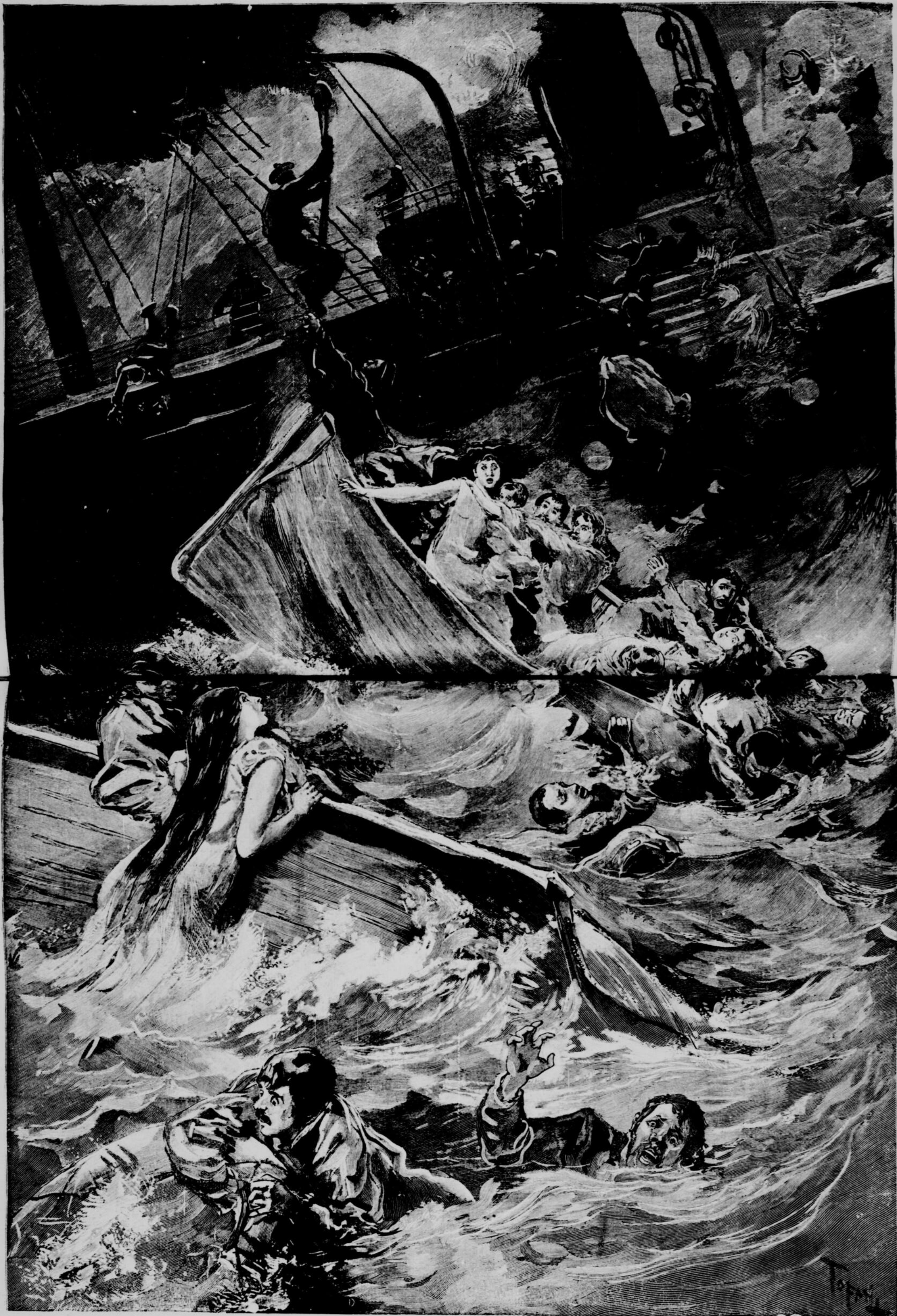
LA CATASTROPHE DE "L'ELBE."—Dessin de Tofani