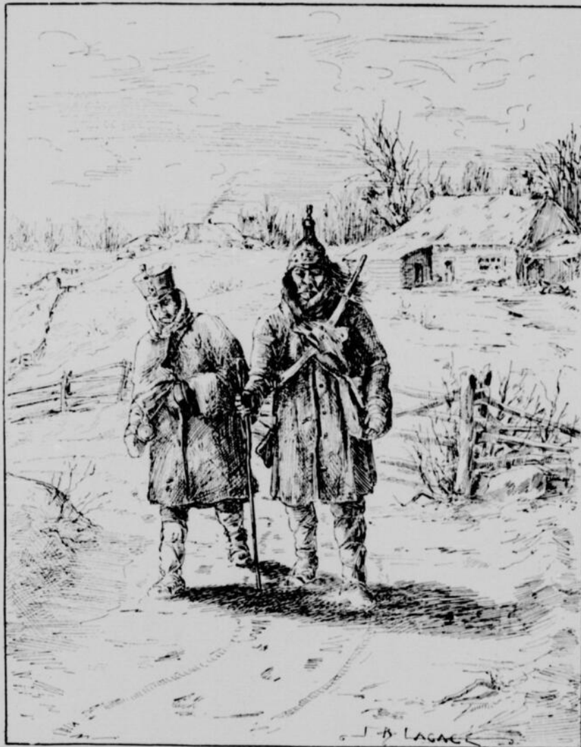
LA NUIT EST CLAIRE....

goisse des mourants, des scènes sanglantes occupent encore leur imagination ; ils marchent silencieux, machinalement, accablés de fatigue, torturés par la faim, pliant sous le poids de leurs armes dont ils n'auront bientôt plus la force de se servir. Devant eux, l'inconnu plein d'horreurs ; derrière eux, des ennemis implacables.