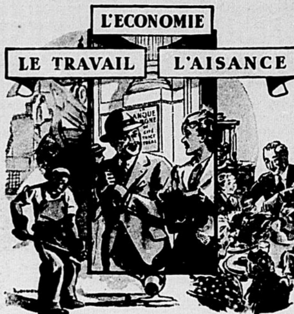
Les trois facteurs indispensables pour vivre heureux.

Ottawa s'est particulièrement intéressée, cette semaine, à cause de conversations avec Washington au sujet des fournitures de guerre, à la préservation et à la stabilisation des crédits du Canada en temps de guerre. Le Canada jusqu'ici n'a pas manqué à ses engagements financiers aux Etats-Unis à la suite d'emprunts et son crédit s'est maintenu excellent. De ce fait, le pays occupe une position privilégiée quant aux emprunts futurs et rien ne sera toléré qui puisse faire tort à cette bonne réputation. Ceux qui au Canada font l'erreur de suggérer un relâchement dans le strict contrôle de la monnaie à cause des exigences de la guerre, n'ont pas envisagé l'étendue du dommage que causerait une telle politique advenant la prolongation du conflit. En plus de nuire considérablement à tous les particuliers qui possèdent quelques biens au Canada, soit en épargne, soit en placements de production d'une fausse monnaie dépréciée compromettraient sérieusement le crédit du Canada à l'étranger. Avec sa politique de "Fay des développements industriels sans vous go", "Payer à mesure", le