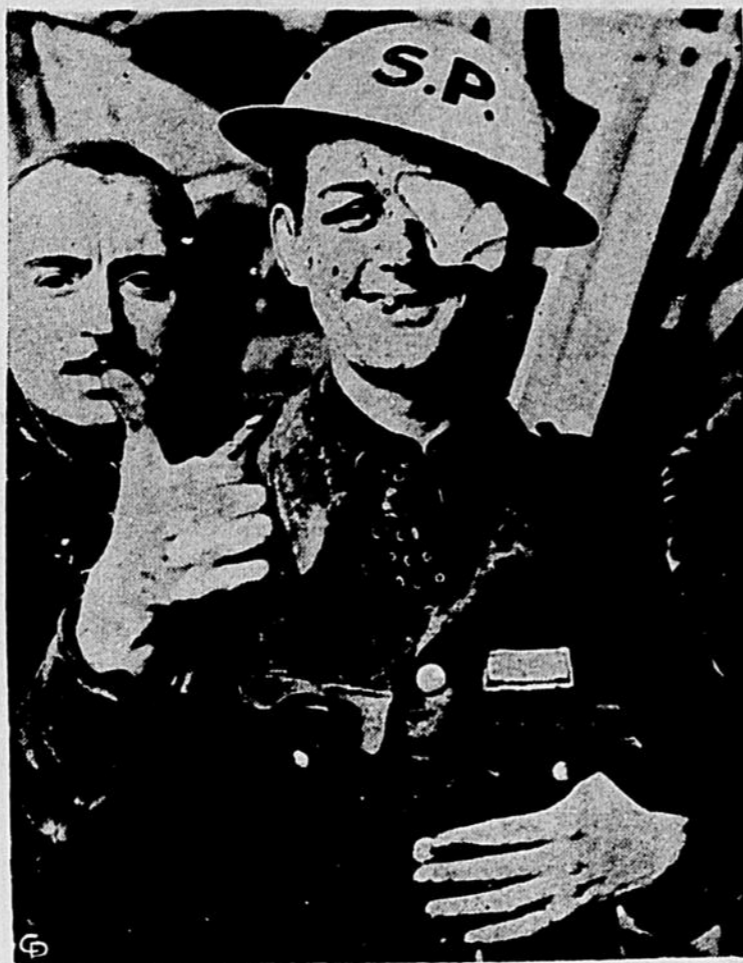
L'esprit qui anime les habitants de la Grande-Bretagne malgré les bombardements barbares des aviateurs nazis, est bien illustré ici par ce soldat qui, malgré ses blessures, continue son service avec un air joyeux, narquois même.

de l'Office Central Catholique Limitée, ces derniers, importateurs d'articles religieux.