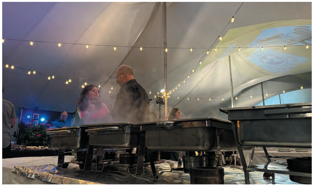
La fumée dégagée par les plats n'était pas la seule chose à emplir l'air lors de cette Table Champêtre à la FermeDesrosiers, en effet, une ambiance chaleureuse et conviviale se dégageait des interactions entre les invités. Les lumières suspendues sous le chapiteau ajoutaient une touche de magie, créant un décor intime qui invitait à la détente et à la convivialité.