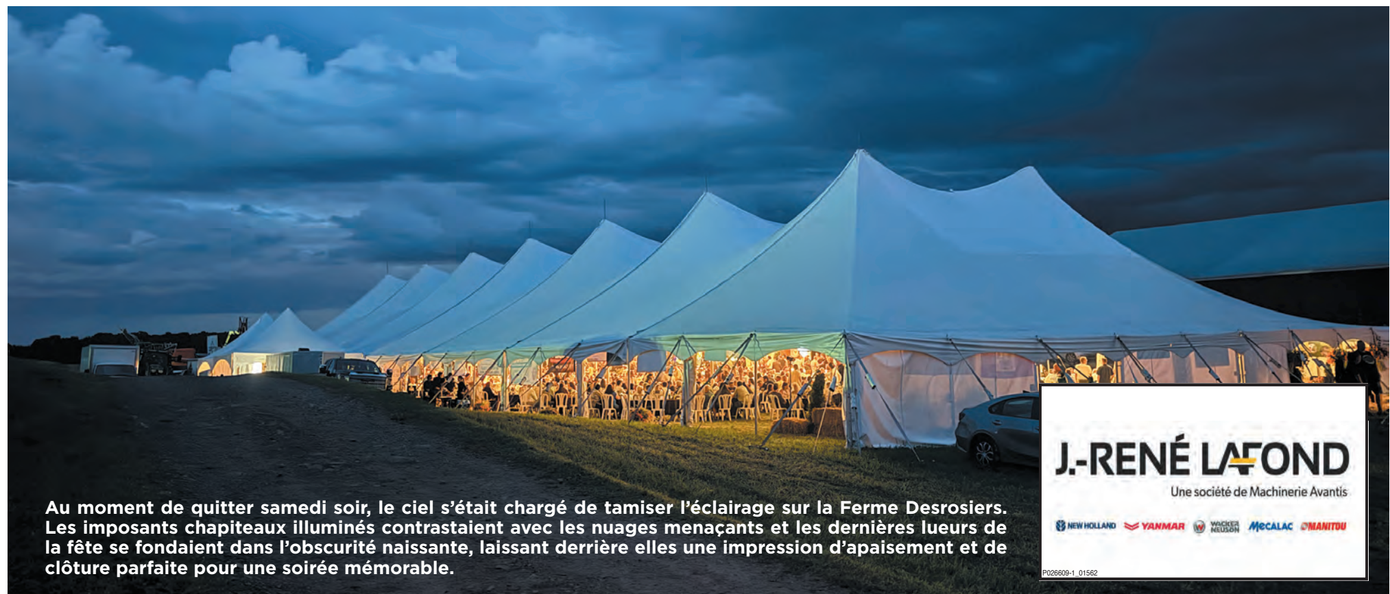
Au moment de quitter samedi soir, le ciel s'était chargé de tamiser l'éclairage sur la Ferme Desrosiers. Les imposants chapiteaux illuminés contrastaient avec les nuages menaçants et les dernières lueurs de la fête se fondaient dans l'obscurité naissante, laissant derrière elles une impression d'apaisement et de clôture parfaite pour une soirée mémorable.