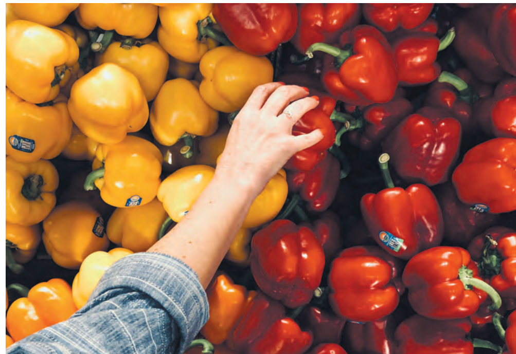
Le Code de conduite du secteur de l'épicerie mettra en place une réglementation encadrant les échanges entre les grands détaillants et les producteurs à partir de juin 2025.

Sébastien Vachon, président des Producteurs de bovins du Québec (PBQ), a