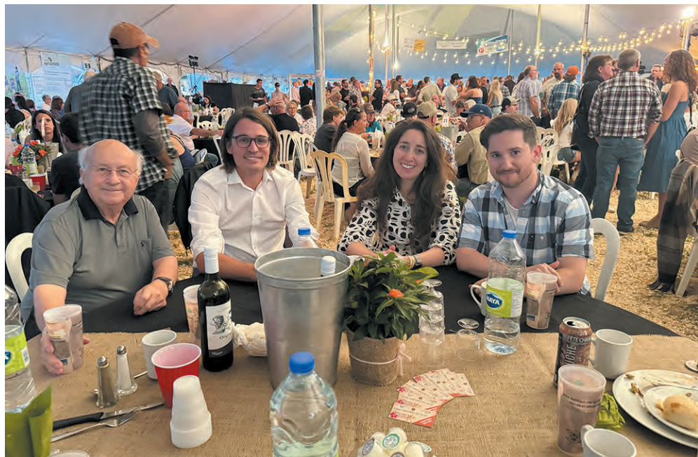
Le député fédéral de Mirabel, Jean-Denis Garon avec amis et collègues, profitant du temps qu'il faut pour prendre une photo pour se reposer les jambes, lui qui a été vu discutant avec ses concitoyens toute la soirée.