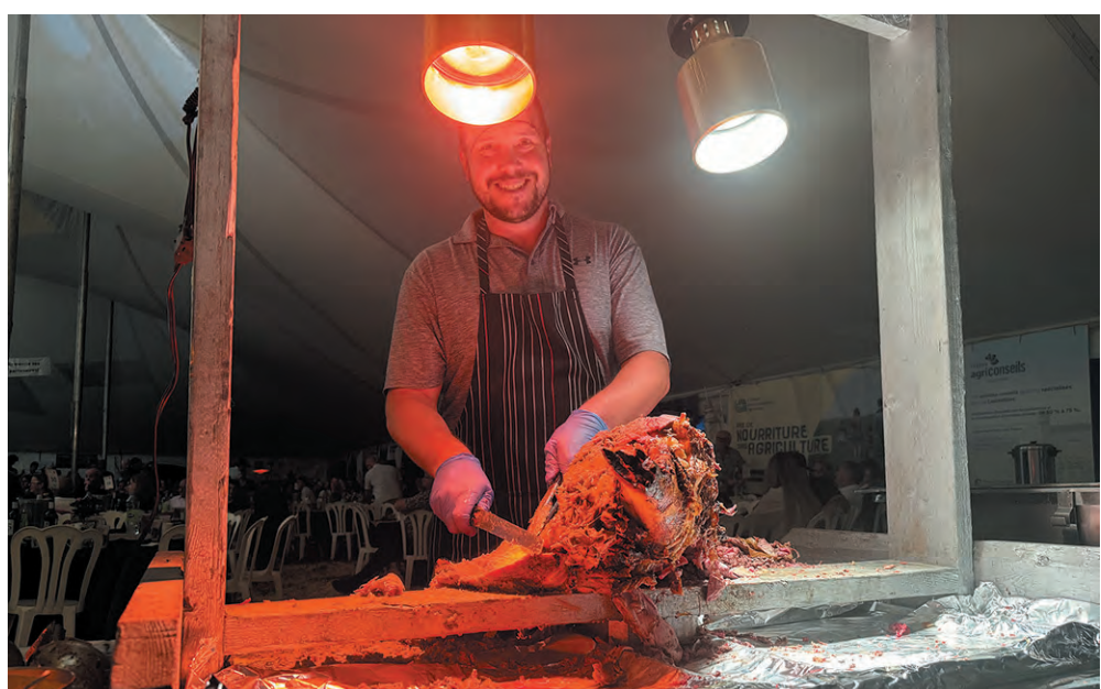
Le buffet en a fait saliver plus d'un. En effet, l'achalandage impressionnant de l'événement a créé un peu de congestion autour du buffet une fois l'heure du souper venue. Personne ne s'en plaignait par contre et les sourires étaient aussi grands que les appétits.