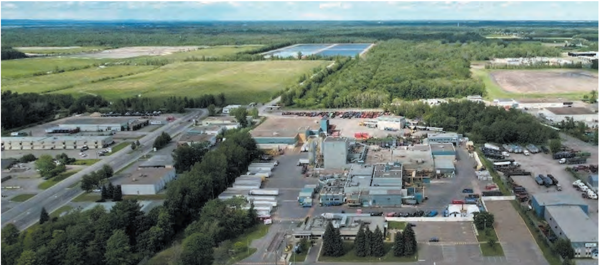
Malgré les recommandations du BAPE, Québec souhaite aller de l'avant avec le projet de la cellule 6 de Stalex.