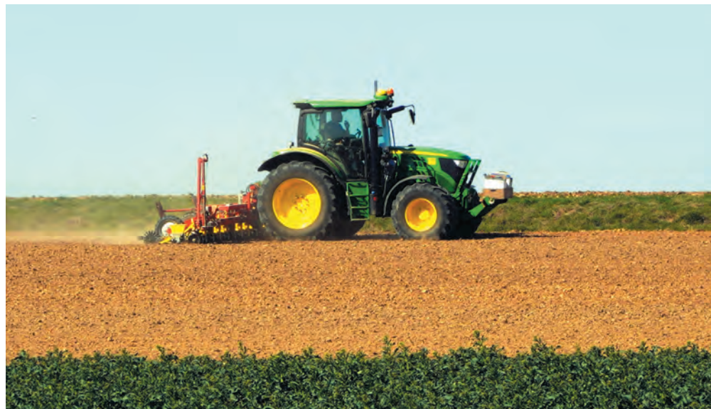
Les résultats montrent une saison avec des réussites significatives, mais également des défis liés aux conditions climatiques.

de dommages jusqu'à présent, principalement pour les céréales, le maïs-grain, les protéagineuses et la sauvagine, contre 2 485 à la même période l'année précédente. Les indemnités versées totalisent actuellement 4 957 751 de dollars. En 2023, les indemnités versées se sont élevées à près de 17 000 000 de dollars. À la vue de ces chiffres, nous serions donc portés à croire que la saison 2024 risque d'être plus profitable que celle de l'an passé.