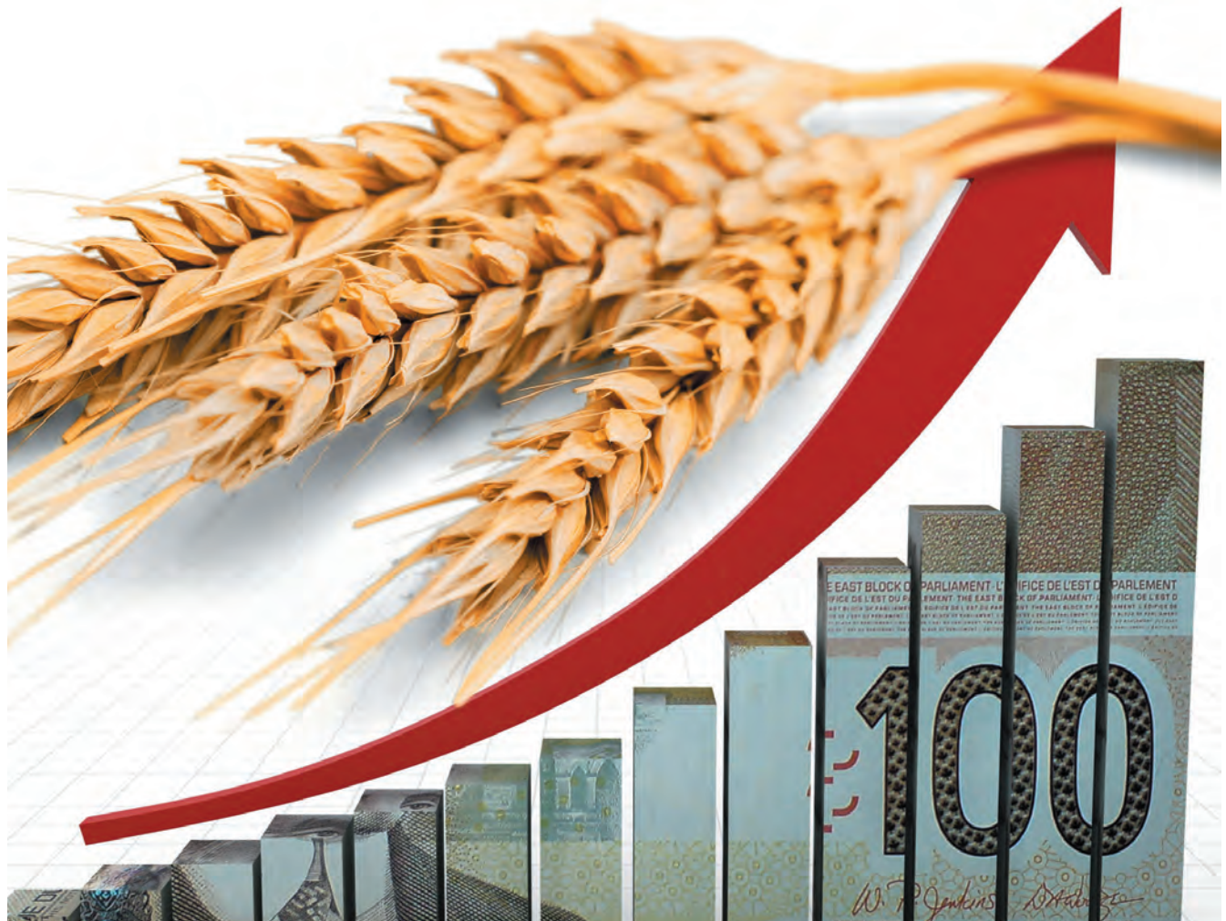
Québec a annoncé une série de mesures à court terme pour aider financièrement les entreprises agricoles.

Demandé dès novembre 2023, on nous promet le déclenchement d'Agri-relance, le programme