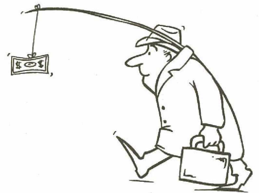
Archives : Illusion Emploi

Malgré sa promesse d'une réforme, qui date de deux ans, le gouvernement contribue par son inaction et son hésitation à bien servir le patronat et à ignorer la population. Il est temps de lui rappeler qu'il doit se responsabiliser envers ces travailleuses et ces travailleurs.