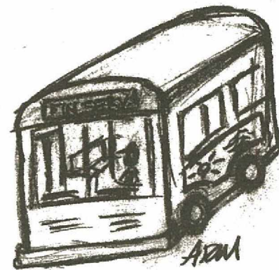
Dessin : Ana Rosa Mariscal