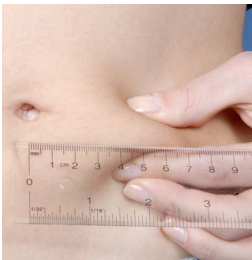
Sur le ventre à 5 cm (2 pouces) du nombril