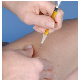
Sur le devant de la cuisse côté externe