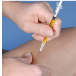
Figure 1-B: Sur le devant de la cuisse côté externe