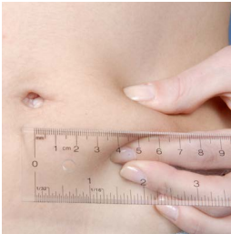
Figure 1-A: Sur le ventre à 5 cm (2 pouces) du nombril