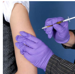
Côté externe du bras