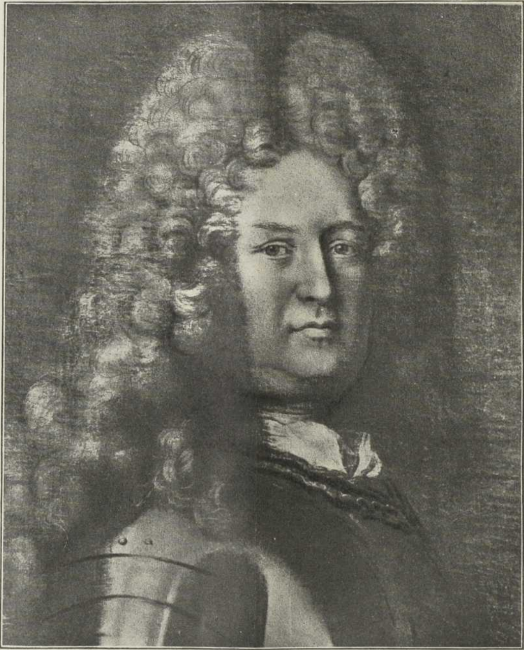
JACQUES-RENÉ DE BRISAY, MARQUIS DE DENONVILLE GOUVERNEUR DE LA NOUVELLE-FRANCE—1685-1689