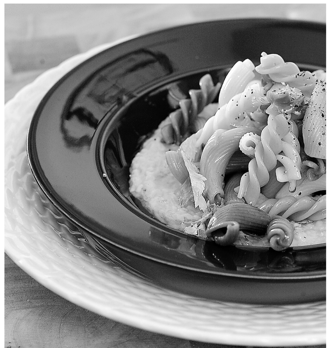
Pâte à la purée de haricot et feuilles de céleri. J'ai utilisé des pâtes sèches bios aux légumes.