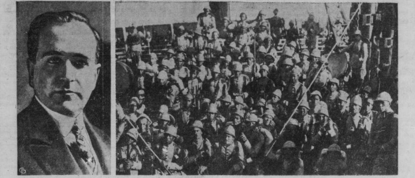
La révolte continue de jeter la terreur au Brésil. Organisée par les communistes, y compris les Socialistes et les anti-impérialistes, elle menace de prendre de sérieuses proportions. A gauche, le président du Brésil, M. G. ETULIO VARGAS, qui décréta sous peu la loi martiale dans le nord du Brésil, à moins que la situation ne s'améliore d'ici à quelques jours. A droite, les troupes fédérales qui se dirigent à la rencontre des révolutionnaires après la capture des villes de Pernambuco et de Natal.