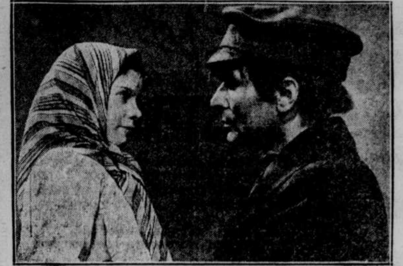
Madeline Oeray et Pierre Blanchard dans "Crime et Châtiment" avec Harry Baur le génial acteur. Ce film prendra l'affiche samedi prochain et sera en programme double.