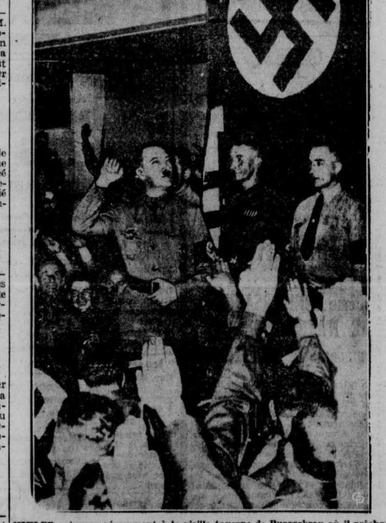
HITLER retourna récemment à la vieille taverne de Burgerbrau où il prêcha pour la première fois l'idée de l'Hitlerisme, en 1923. On le voit répondre aux saluts et souhaits de ses anciens camarades. Le chancelier fit le voyage pour inaugurer les quatre gros édifices néo-grecs de Munich, mais cancella la moitié des cérémonies de la journée pour aller fêter un peu avec ceux qui, les premiers, ont encouragé son mouvement.