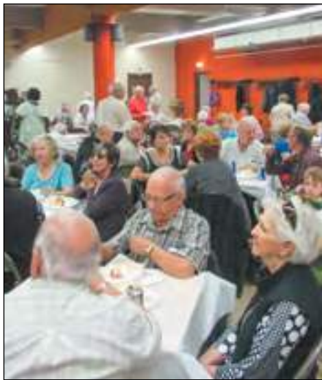
Une partie de l'assistance présente lors du lancement de l'année pastorale organisé par les Chevaliers de Colomb.