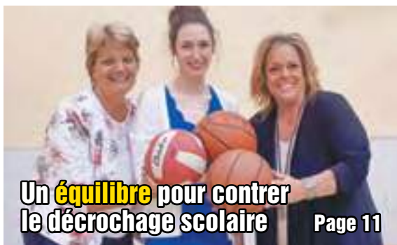
Un équilibre pour contrer le décrochage scolaire