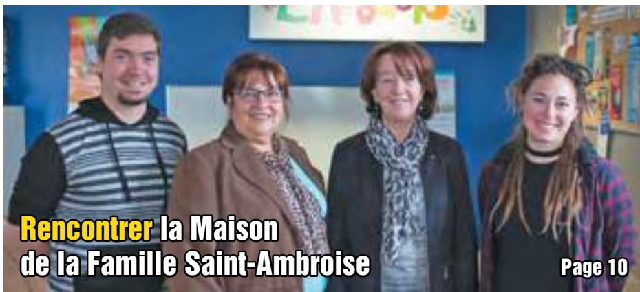
Rencontrer la Maison de la Famille Saint-Ambroise