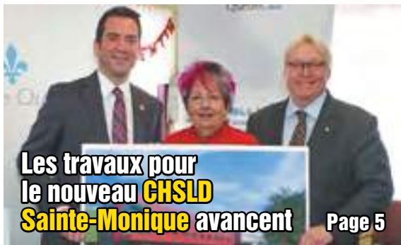
Les travaux pour le nouveau CHSLD Sainte-Monique avancent