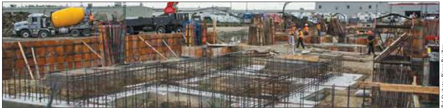
L'avancement des travaux pour le nouvel Hôpital Sainte-Monique en date du 27 septembre 2017.