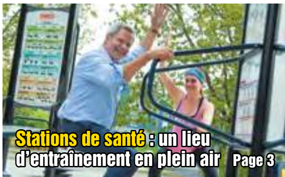
Stations de santé : un lieu d'entraînement en plein air

Lundi ..... 8 h 30 à 16 h Mar. au jeu. .... 8 h 30 à 20 h Vendredi ..... 8 h 30 à 18 h Samedi ..... 9 h à 13 h