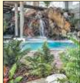
Le Spa O'Quartz de l'Hôtel du Petit Manoir du Casino de Charlevoix