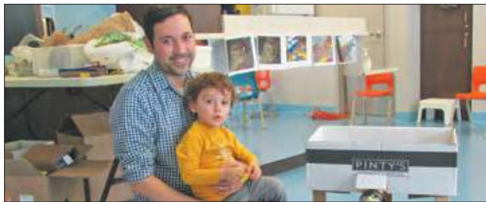
Bricolage, construction, coloriage et découverte de plusieurs activités sont au menu lors des activités pères et enfants.

Lors des plus récentes rencontres de « Papa et moi d'abord », les familles ont confectionné des œufs de dinosaures, fait des courses de fusées et même construit un village tout en carton. Ce programme représente une occasion particulière pour les pères de passer un bon moment en compagnie de leurs enfants, mais aussi de rencontrer d'autres parents dans une ambiance amicale et décontractée. ■