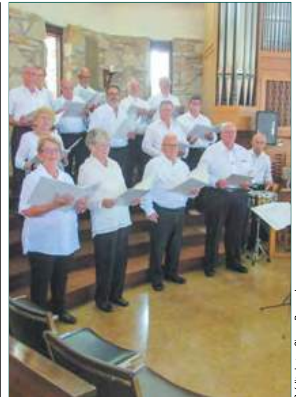
La chorale du Conseil Montcalm « Les Joyeux Troubadours » a présenté plusieurs prestations musicales durant la cérémonie de l'intronisation.

Journal-Local.ca 10 ans D'INFORMATIONS LOCALES