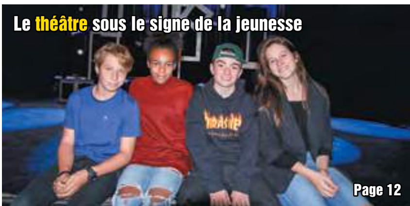
Le théâtre sous le signe de la jeunesse