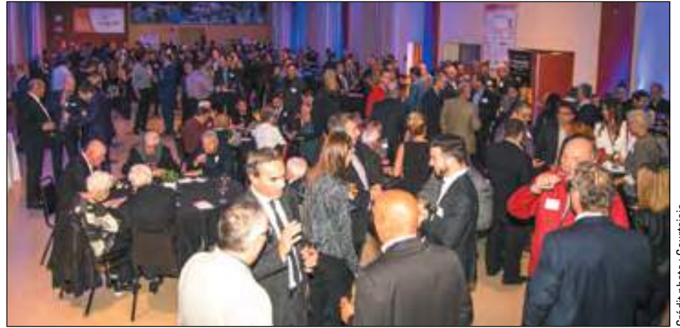
L'événement du Cocktail-bénéfice du Centre Durocher est une occasion particulière pour les organisateurs de récolter des fonds pour développer plusieurs projets.

Cette soirée sera l'occasion pour le Centre Durocher d'amasser des fonds afin de développer des programmes sportifs, culturels et éducatifs pour les jeunes défavorisés de la Basse-Ville de Québec. La mission du Centre Durocher vise à améliorer les conditions de vie par la prise en charge individuelle et collective en utilisant le moyen privilégié du loisir, de l'action communautaire et de l'éducation populaire. ■