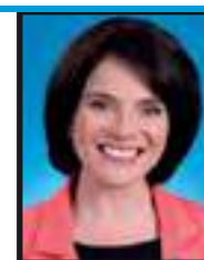
Veronique Tremblay Députée de Chauveau