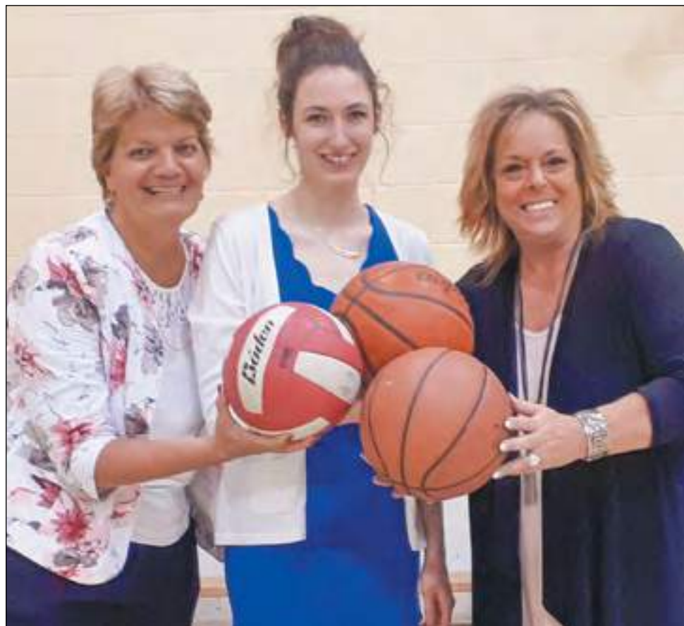
Le programme DAM permet aux jeunes d'allier le sport et les études afin de contrer de manière efficace le décrochage scolaire.

L'organisme le Diplôme avant la Médaille a notamment été reconnu sur les scènes locale, régionale et provinciale en recevant plusieurs prix nationaux et des bourses. Le Prix national de Forces AVENIR dans la catégorie « Avenir projet engagé : société, communication, éducation et politique » au collégial (2013), la bourse des Jeunes Boursiers des Grands Québécois de la Chambre de Commerce et d'Industrie de Québec (2013), la Bourse de leadership et développement durable de l'Université Laval (2013 à 2016) et le Prix national du Défi OSEntreprendre dans la catégorie « Entrepreneurat étudiant: individuel et petit groupe » (2016) démontrent l'ampleur du programme DAM. ■