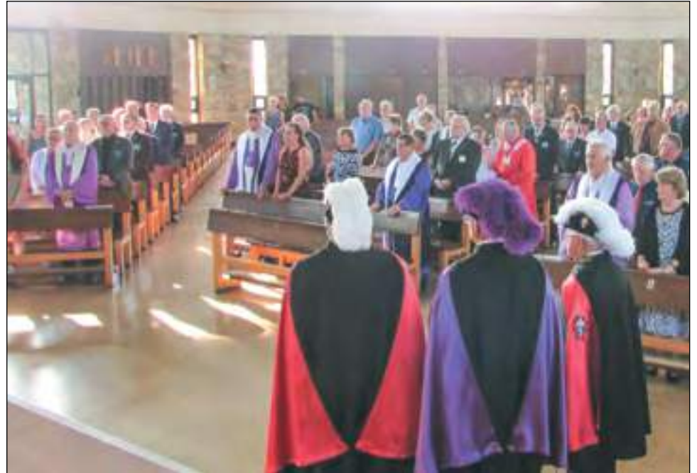
Plusieurs dizaines de personnes ont participé à la cérémonie d'intronisation, qui a été un véritable succès, selon les organisateurs.

La chorale du Conseil Montcalm « Les Joyeux Troubadours » fournissait l'ensemble de la prestation des chants. Après la cérémonie, le Conseil Montcalm recevait l'ensemble des délégations de chaque Conseil, soit plus de 150 personnes, lors d'un souper fraternel. ■