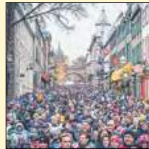
La Grande Marche de Québec 2016

Le Grand défi Pierre Lavoie et la Fédération des médecins omnipraticiens du Québec (FMOQ) sont fiers d'inviter le grand public à la troisième Grande marche qui aura lieu les 21 et 22 octobre prochains dans 22 municipalités de la province, dont Québec pour la deuxième fois. La Grande marche de Québec se tiendra le samedi 21 octobre au cœur du Vieux-Québec. Partant de la Fontaine de Tourny devant le Parlement de Québec, le parcours de 5 km sillonnera les rues de la vieille ville. Les marcheurs pourront admirer le Château Frontenac, la Basilique-Cathédrale Notre-Dame de Québec, le Séminaire de Québec ainsi que les remparts. Le retour se fera sur l'une des plus anciennes rues de Québec, la rue St-Jean. Le dernier droit du parcours empruntera la Grande-Allée, célèbre pour son architecture victorienne et ses restaurants.