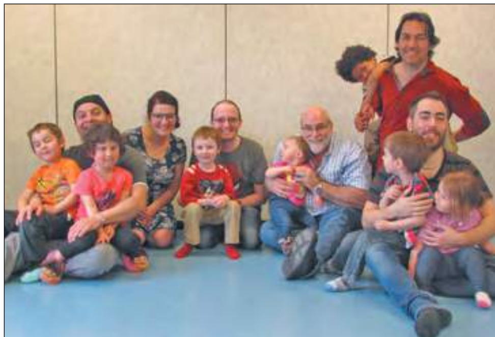
Lors des activités du programme « Papa et moi d'abord », les pères effectuent toute sorte d'activités avec leurs enfants.