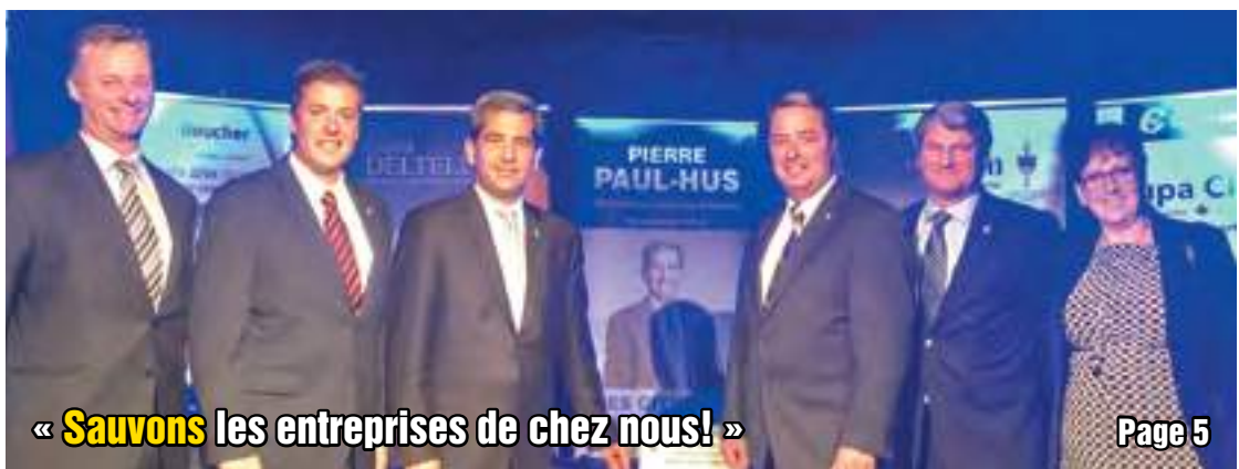
« Sauvons les entreprises de chez nous! »