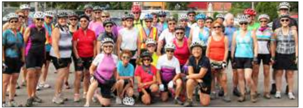
Plusieurs membres du Club de marche Volkssport Nord-Sud lors de l'une de leurs randonnées cycliste durant la saison estivale 2017.

• Les 7, 8, 9 octobre prochains, 85 membres feront une escapade à Rimouski pour découvrir les splendeurs du Parc National du Bic et le Canyon des Portes de l'Enfer. Ce voyage est complet et réservé aux membres seulement.