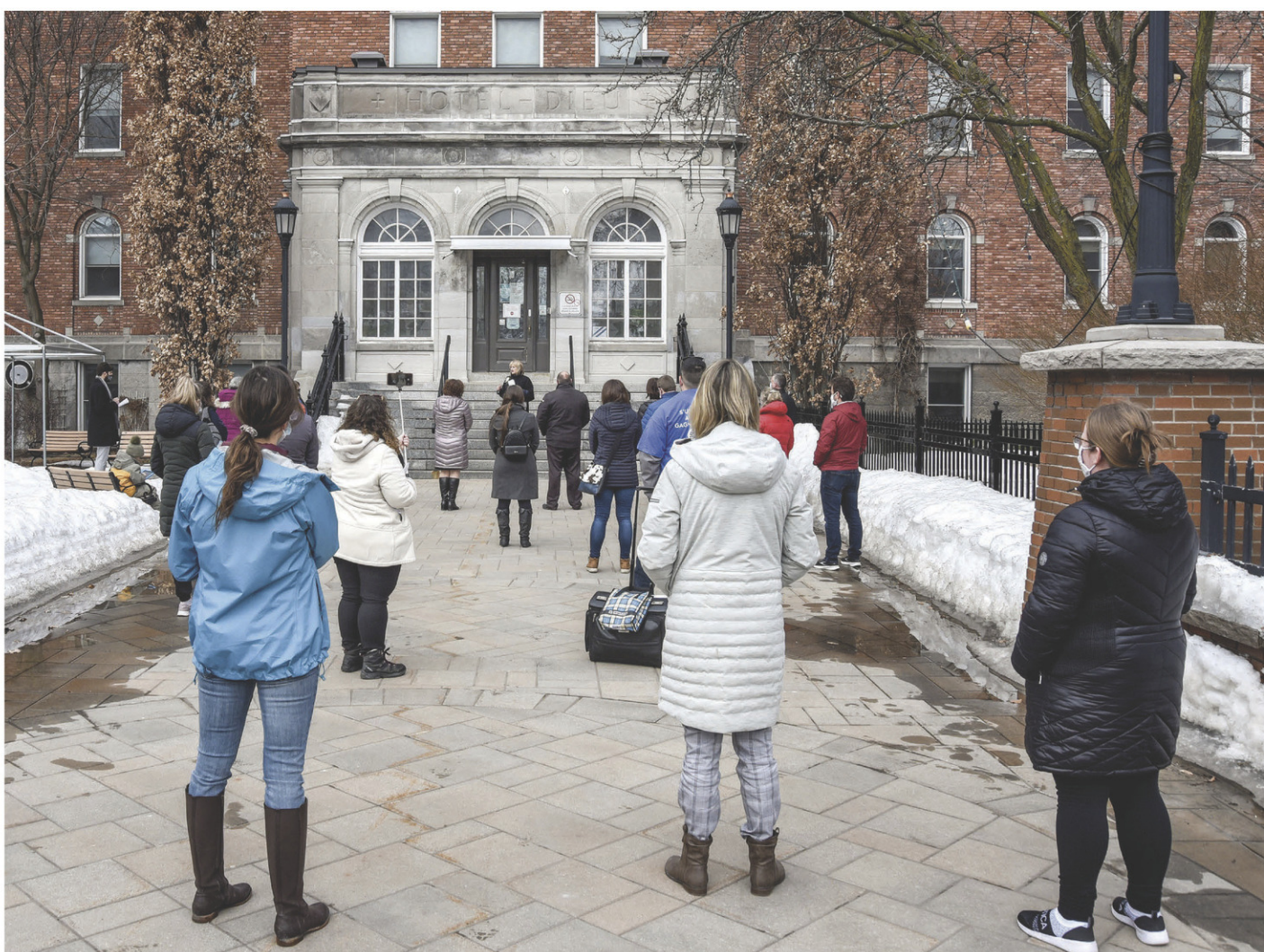
Un peu plus d'une vingtaine de personnes, autant des dirigeants que des représentants syndicaux et des employés de la santé, étaient présentes à la cérémonie de commémoration des victimes de la pandémie, qui s'est tenue devant l'Hôtel-Dieu.