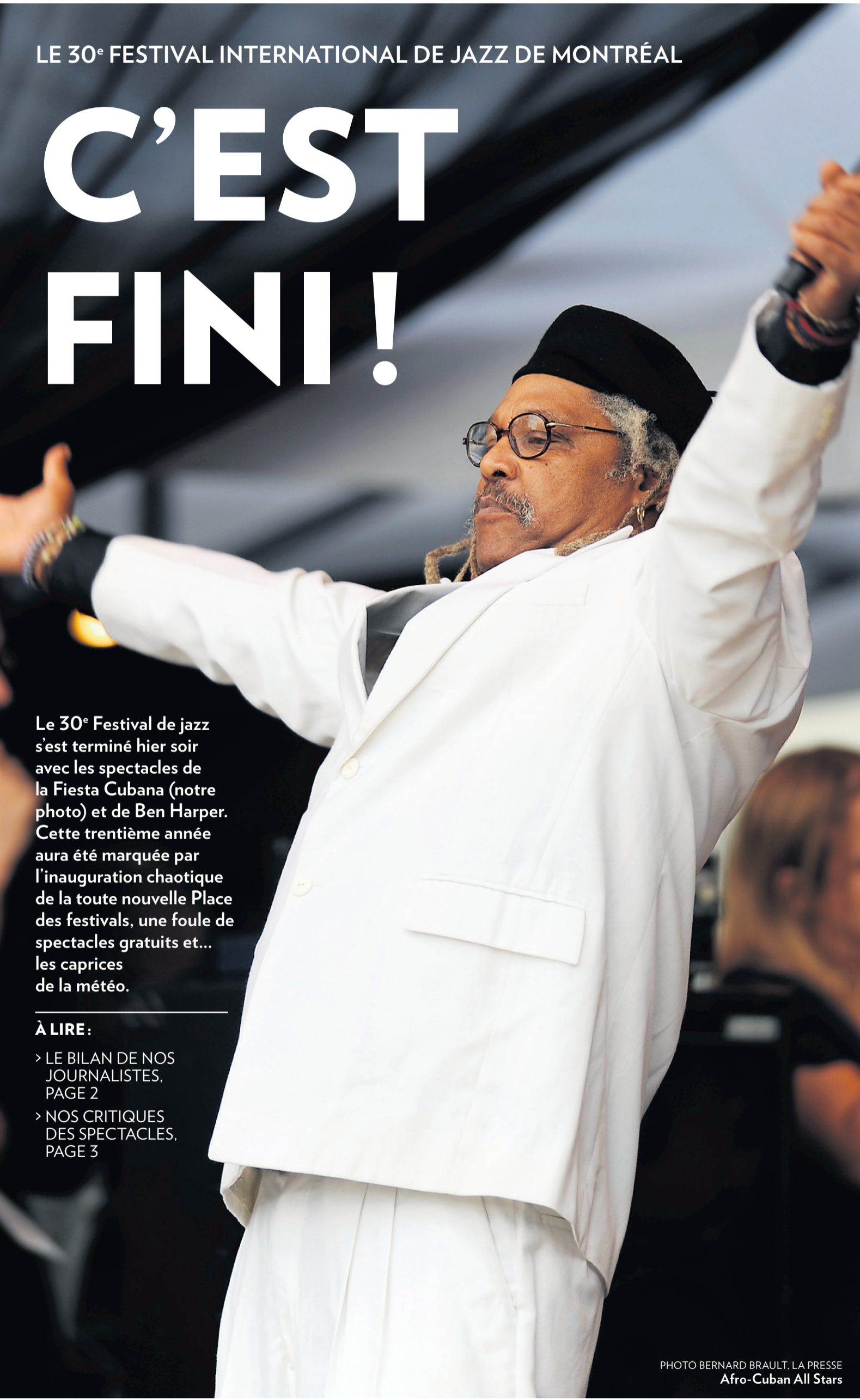
Afro-Cuban All Stars