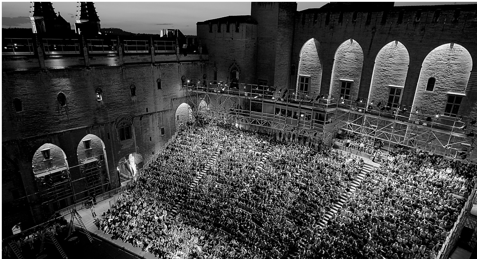
Les trois premières pièces de la tétralogie de Wajdi Mouawad, Le Sang des promesses , ont été présentées dans la Cour d'honneur du palais des Papes au Festival d'Avignon. Un marathon de 11 heures qui s'est déroulé la nuit, devant des spectateurs enthousiastes emmitouffés dans des couvertures.