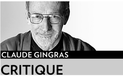
CLAUDE GINGRAS CRITIQUE

Étonner en offrant de l'inédit. Pour le très regretté père Fernand Lindsay, c'était là le but premier d'un festival et monter la Messa per Rossini rejoignait tout à fait cette idée. Les circonstances ont voulu que cet hommage rendu au célèbre compositeur d'opéra par 13 de ses collègues devienne, pour les 2 500 spectateurs de vendredi soir à l'Amphithéâtre, une cérémonie à la mémoire du fondateur du Festival de Lanaudière.