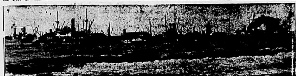
Au port de Rimouski

Imprimé par l'Imprimerie Gilbert, Limitée.