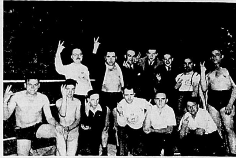
Lors d'une séance de lutte. On remarque, avec les lutteurs, des officiers de l'Ordre des Chevaliers de Colomb.