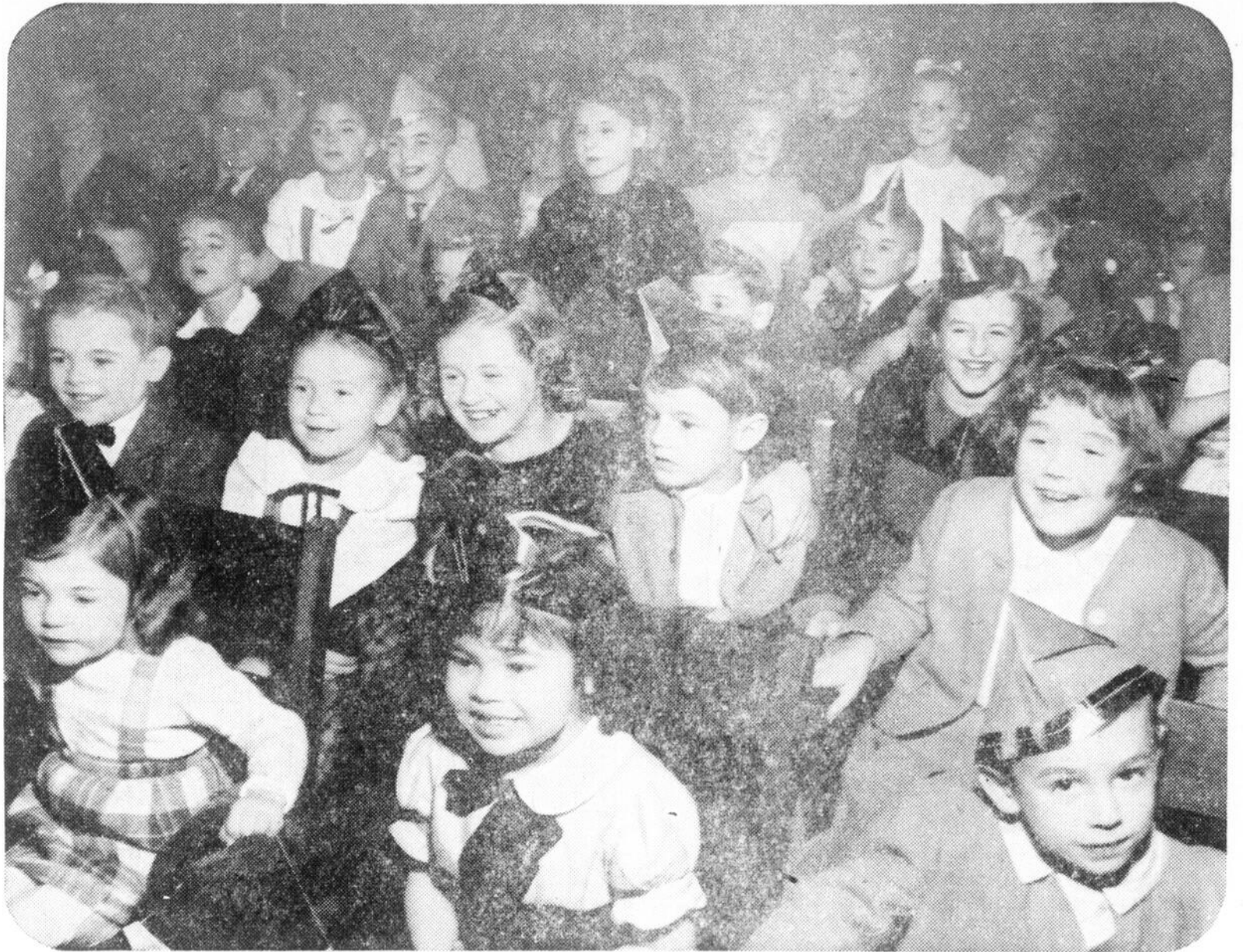
Quelques-uns des joyeux invités à la Fête de Noël des employés de Molson's en 1948.