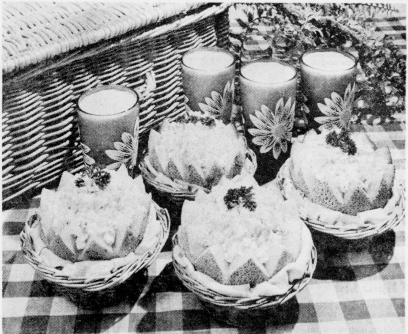
VOICI QUI FERA LES DELICES MEME DES PLUS FINS