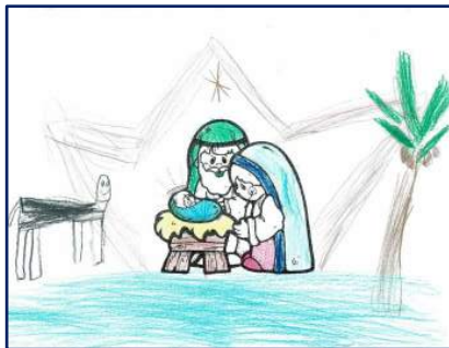
Marie-Alice Labbé, 6 ans; gagnante de l'Évangile pour les enfants