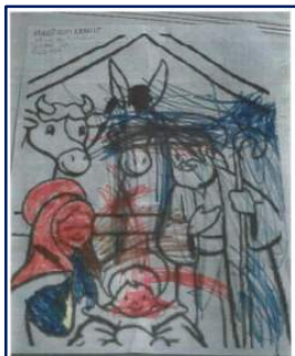
Madison Neault, 4 ans; gagnante de "Chaque jour un petit mot de Dieu »