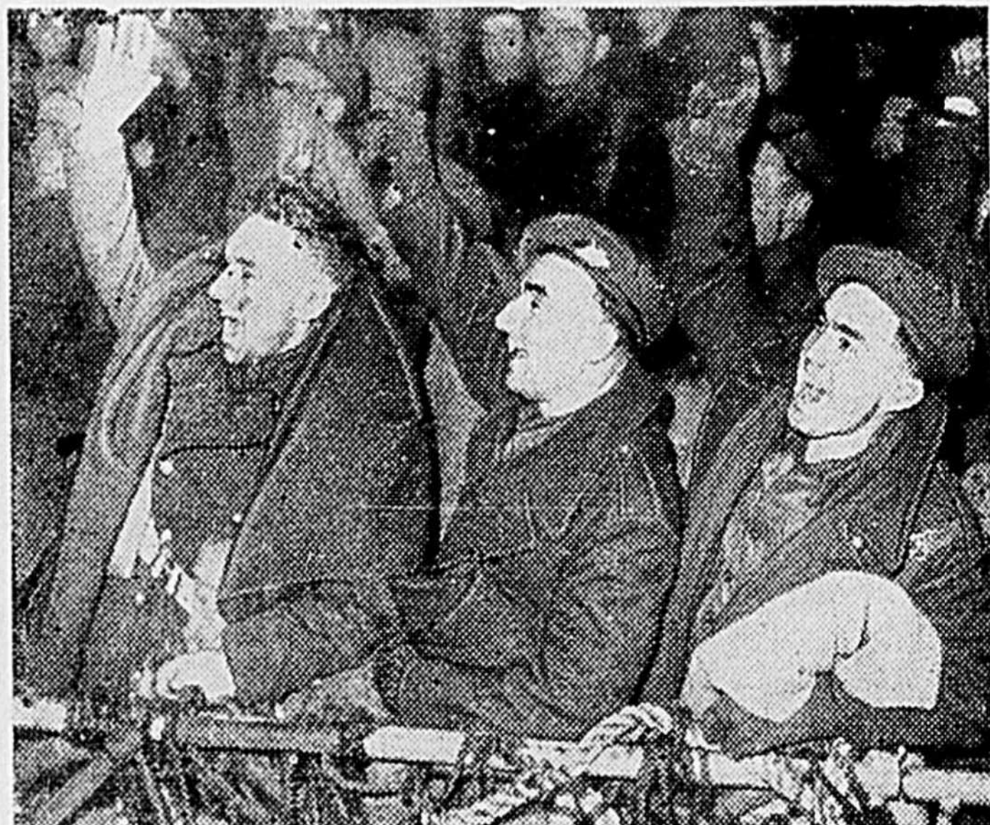
La gravure représente quelques-uns des hommes chanceux se réjouissant à leur retour de l'invasion.