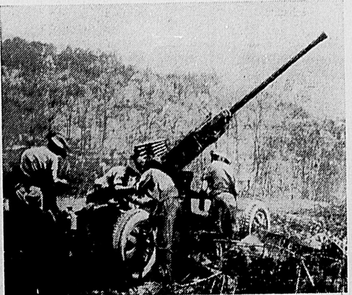
Canon anti-aérien en action, à 1,330 pieds au-dessus du niveau de la mer, sur le roc de Gibraltar.