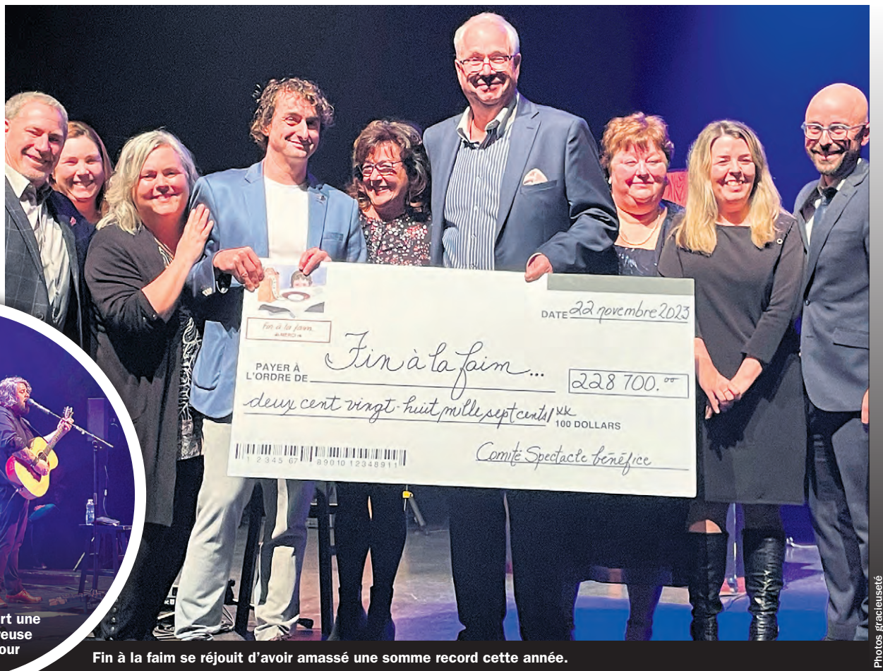
Fin à la faim se réjouit d'avoir amassé une somme record cette année.