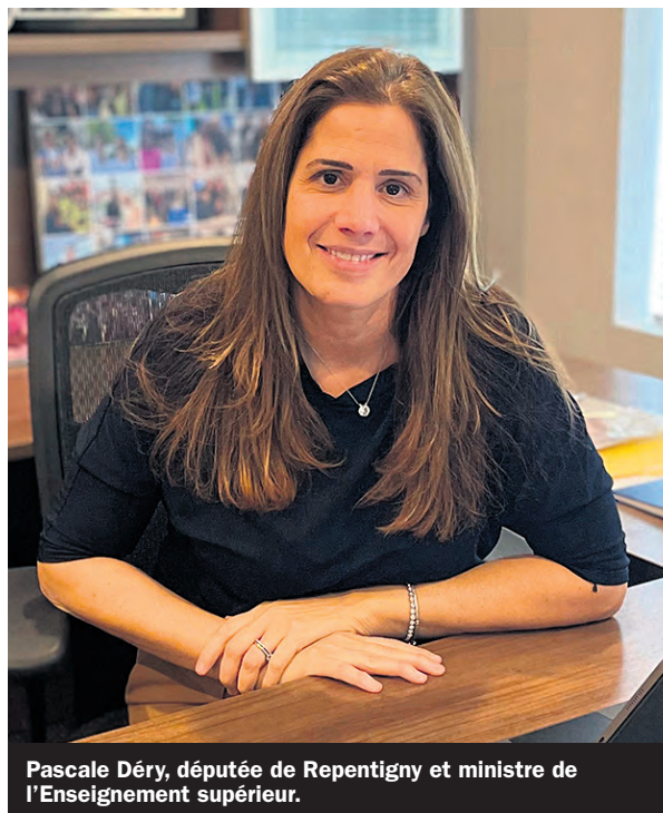
Pascale Déry, députée de Repentigny et ministre de l'Enseignement supérieur.

Néanmoins, les pistes actuellement étudiées ne répondraient que partiellement à la demande des étudiants. Plutôt qu'une rémunération globale de tous les stages, le gouvernement étudierait la possibilité de rémunérer certains stages ciblés du secteur public seulement. Les secteurs de la santé et de l'éducation pourraient bien en faire partie. Cependant, aucun domaine n'a encore été défini de manière officielle. Prudente, la ministre souligne : «Ce sera la première fois qu'on procédera à la rémunération