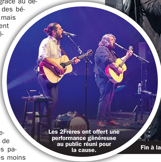
Les 2Frères ont offert une performance généreuse au public réuni pour la cause.

Au-delà des généreux paniers de Noël distribués chaque année à plus de 300 familles du territoire, Fin à la faim assure le service de dépannage alimentaire chaque semaine. En 2022, un total de 8795 dépannages a été fourni aux personnes qui en avaient besoin. En moyenne, 195 familles en ont bénéficié chaque semaine.