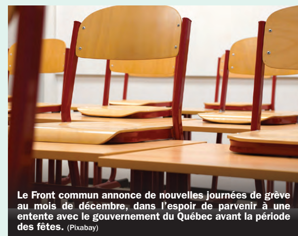
Le Front commun annonce de nouvelles journées de grève au mois de décembre, dans l'espoir de parvenir à une entente avec le gouvernement du Québec avant la période des fêtes.

Les syndicats estiment que l'arrivée d'un conciliateur et l'ajout de journées de négociation «ont permis d'arrêter de tourner en rond et ont obligé le gouvernement à répondre clairement à nos demandes». Le Front commun fera le point sur la situation le 18 décembre prochain. (SD)