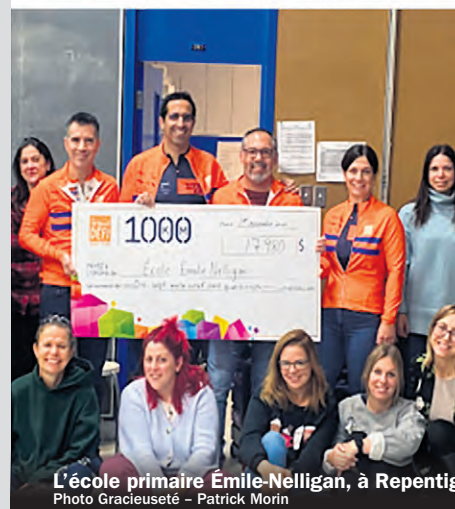
L'école primaire Émile-Nelligan, à Repentigny, compte parmi les cinq écoles soutenues par l'entreprise Patrick Morin.