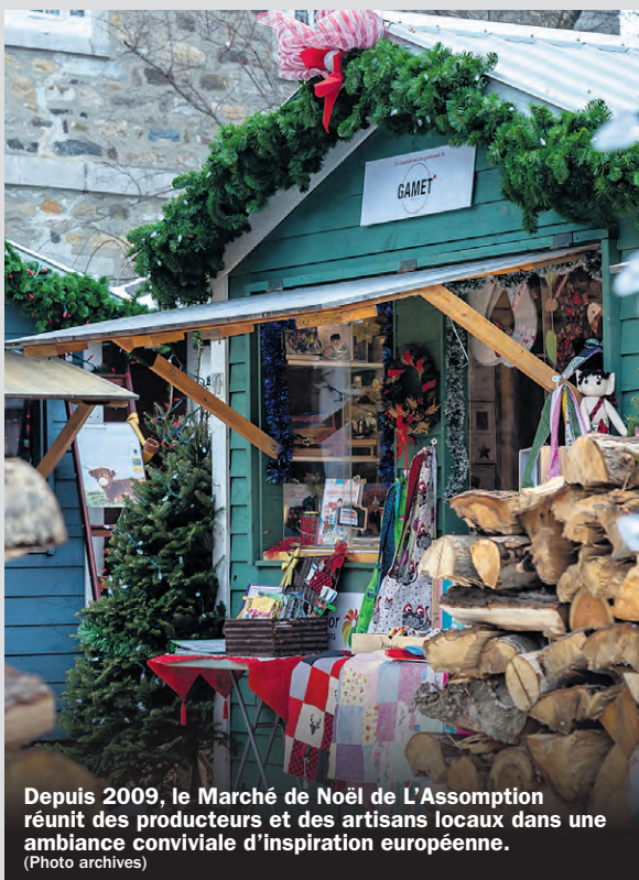
Depuis 2009, le Marché de Noël de L'Assomption réunit des producteurs et des artisans locaux dans une ambiance conviviale d'inspiration européenne.