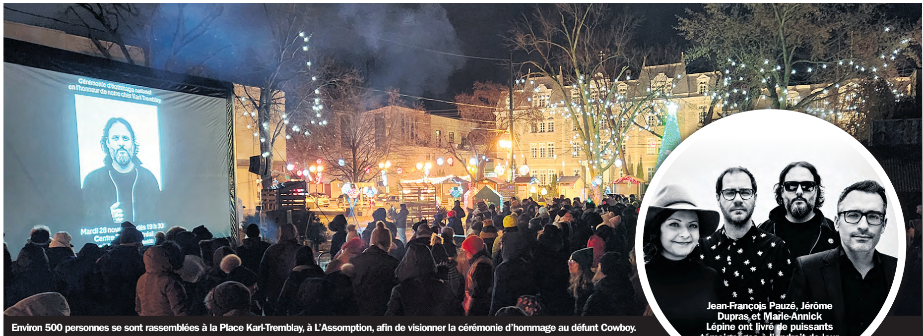
Environ 500 personnes se sont rassemblées à la Place Karl-Tremblay, à L'Assomption, afin de visionner la cérémonie d'hommage au défunt Cowboy.