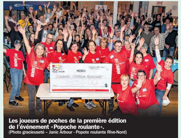
Les joueurs de poches de la première édition de l'événement «Popoche roulante».

« Notre mission ne serait pas possible sans l'engagement de nos précieux bénévoles. Le tournoi-bénéfice «Popoche roulante» est un bel exemple de dévouement.