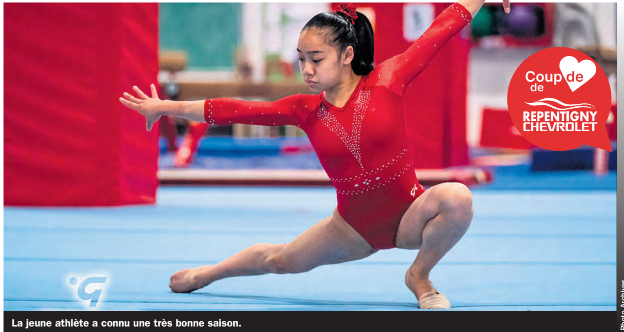
La jeune athlète a connu une très bonne saison.