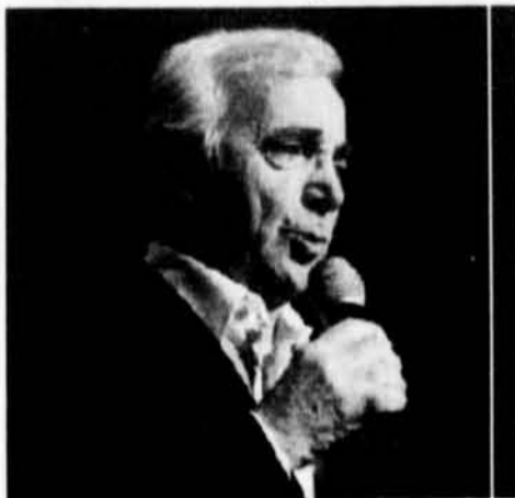
Les textes de Charles Aznavour ont beau être magnifiques, c'est sa voix et son charisme qui touchent le plus.